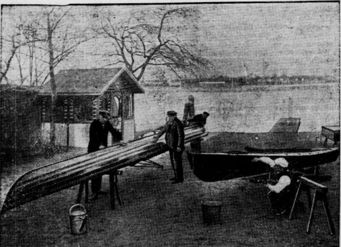
Topla pomlad ne izbavija na prosto samo ljudi, ampak tudi čolne, ki so vso dolgo zimo počivali v shrambah, zdaj pa bodo zopet veselo drčali po vodni gladini