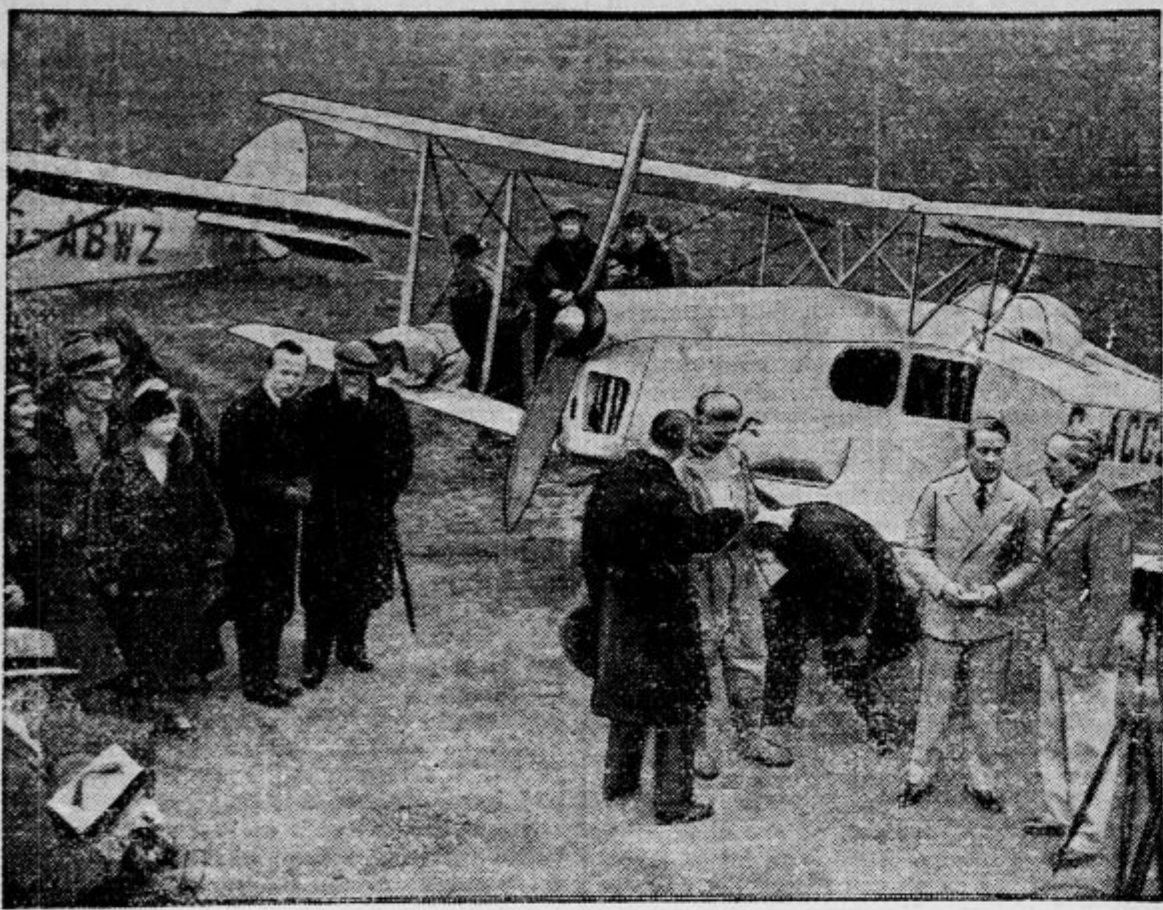
Letala angleške ekspedicije, ki je pod lordom Clydesdaleom dvakrat obletela vršace Himalaje in fotografirala Mount Everest prvič v zgodovini človeškega rodu