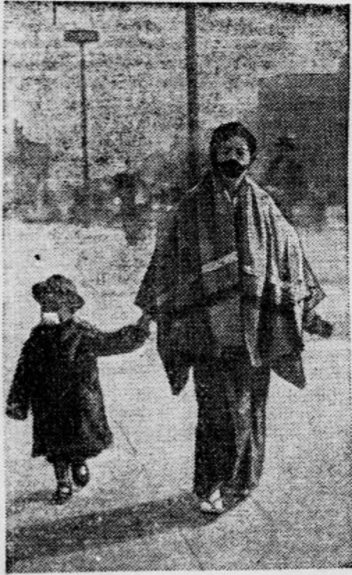
Na Japonskem nosijo ljudje v prehodni dobi maske proti bacilom na ustih in nosu in se s tem čuvarjo kužnih bolezni