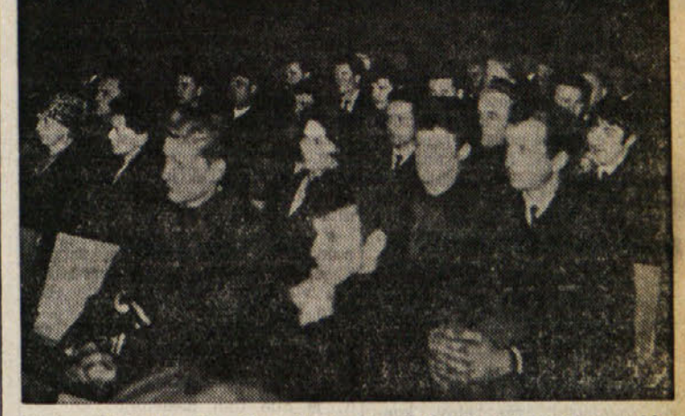
Emigranti iz Beneške Slovenije med nedeljskim zborovanjem v kinu Ristori v Čedadu