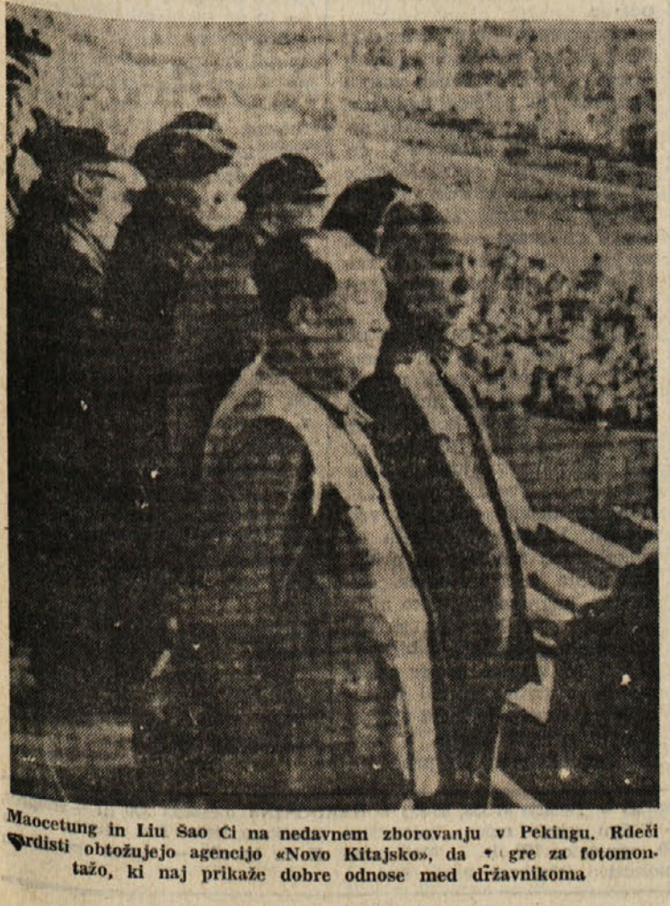
Maocetung in Liu Sao Cij na nedavnem zborovanju v Pekingu. Rdeči gardisti obtožujejo agencijo »Novo Kitajsko«, da gre za fotomontažo, ki naj prikazuje dobre odnose med državnikoma

SANTOS (Brazilija), 9. — V prvih jutranjih urah je v Santosu eksploziral neki gazometer, kar je povzročilo, da so pokopale šipe 6 km nočlo. Več kot 30 oseb je ranjenih, od teh so jih kakih sto prepehili v bolnišnico. Doselej ni vesti, da bi bili tudi mrtvi. Eksplozija je poškodovala veliko število hiš; med temi je prizadeta tudi Pelejeva. Štiri petine prebivalstva bo ostalo brez plina tri ali štiri meseca.