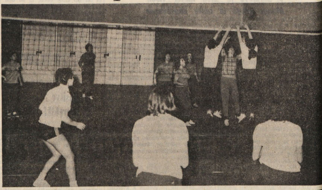
Zenska prva ekipa Bora je v soboto nadvse prijetno presenetila z zmago nad ekipo FARI Modena. Te zmage - lahko rečemo - ni bilo pričakovano, ter so odbojkarice iz Modene močno ekipa iz gornje polovice lestvice.