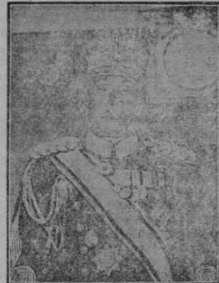
☒ sporu v Mandžuriji. Poveljnik japonskih čet v Mandžuriji, general Minami (desno). Sovjetski vojni minister Vorošilov (levo), ki se bo podal na Daljni vzhod, ker je tudi Rusija zainteresirana na japonsko-kitajskem sporu.