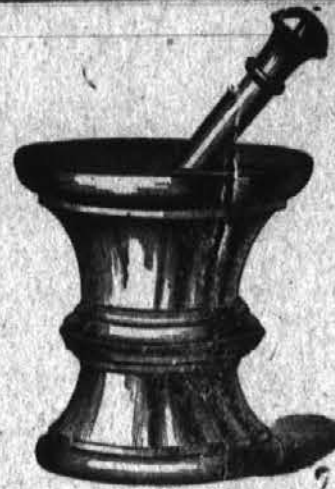
National Drug Store! Slovenska lekarna.