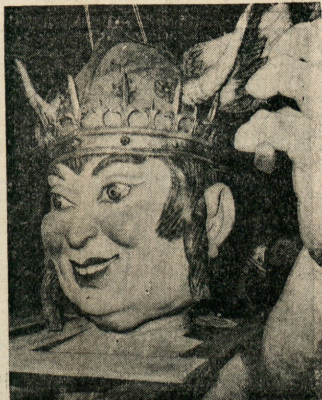
V KARNEVALSKEM SPREVODU — V Nici na Francoski rivieri imajo vsako leto za pusta velik karneval s sprevedom. Na sliki vidimo "Kralja karnevala", oblečenega po vzoru "Asteriksa Galca", znanega iz francoskih zabavnih risank in slikanic.