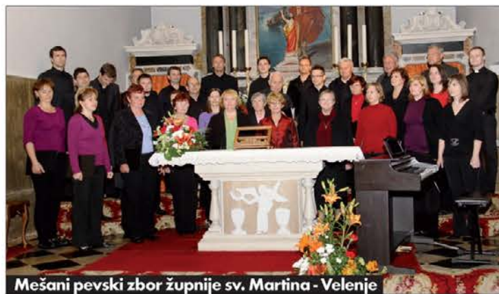
Mešani pevski zbor župnije sv. Martina - Velenje

Taki dogodki, ki poleg visoke umetniške ravni prispevajo še k druženju slovenskih manjšin s rojaki iz matične domovine, so velika spodbuda h gradnji enotnega slovenskega kulturnega prostora.