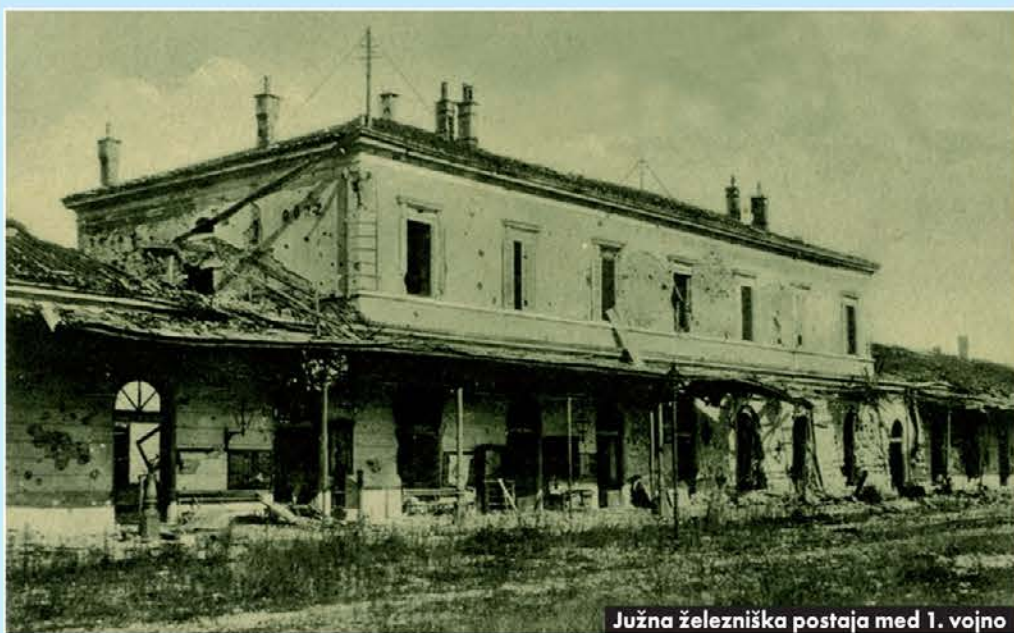
Južna železniška postaja med 1. vojno