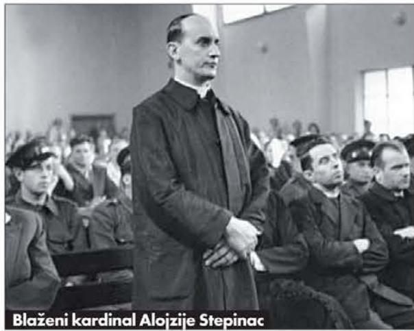
Blaženi kardinal Alojzije Stepinac

Papež Benedikt XVI. bo 4. in 5. junija 2011 obiskal Hrvaško. Obisk bo potekal pod geslom Skupaj v Kristusu , udeležili pa se ga bodo tudi slovenski verniki ter nekateri duhovniki in (nad) škofje. Po prihodu na zagrebško letališče se bo papež Benedikt XVI. najprej srečal s hrvaškim predsednikom Ivom Josipovičem v predsednikovem uradu na Pantovčaku in predsednico hrvaške vlade Jadranko Kosor na apostolski nunciatu. V Hrvaškem narodnem gledališču se bo srečal s predstavniki kulture, akademske skupnosti, podjetnikov, civilne družbe, politike in diplomatskega zbora ter voditelji verskih skupnosti. Ob koncu prvega dne bo prisoten na molitvenem