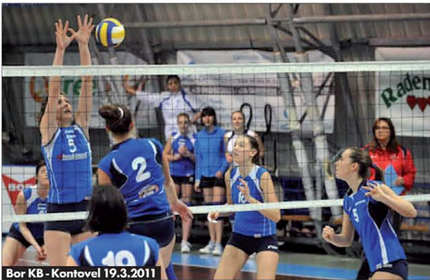
Bor KB - Kontovel 19.3.2011