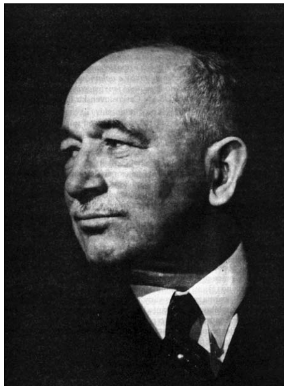
Predsednik Češkoslovaške republike Eduard Beneš. Dějiny země koruny české II. Paseka, Praha-Litomišl 1995.