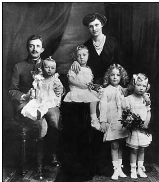
Karel I. z družino.

Ob številnih razlogih tako zunanje kot notranjepolitične narave 24 jih je še posebej načenjal prav odnos do avstrijskega problema, ki se je poleti 1935 še dodatno zaostрил.