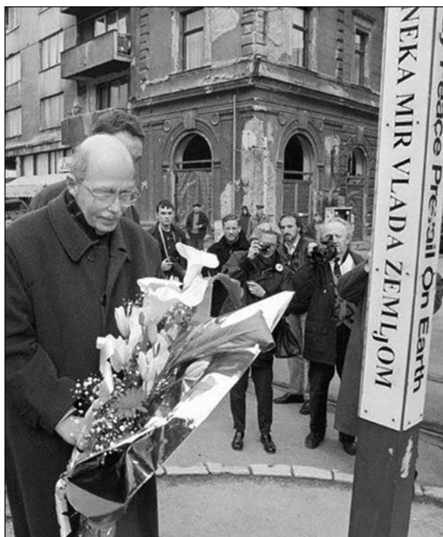
Otto von Habsburg združuje Evropo na drugačen način (med obiskom v Sarajevu leta 1997).

Četrtega julija 1935 je Dunaj sprejel novi »habsburški zakon«, s katerim je članom dinastije Habsburg vrnil odvzeto imetje in jim dovolil vrnitev v državo. Dejanje je tako v Beogradu kot v Pragi hitro vzbudilo silno vznemirjenje. Zazvonil je alarm: pripravlja se restavracija, obnavlja se monarhija. Schuschniggov akt so politični krogi in javnost v obeh državah ostro obsodili. 25 Češkoslovaško in jugoslovansko stališče je ob tem namreč bilo enako: restavracija ne pride v poštev. Toda grozeči Ottov vzpon na prestol tedaj ni predstavljal edinega možnega razpleta perečega avstrijskega problema. Po besedah jugoslovanskega generalnega konzula v Bratislavi se je rešitev kazala v treh možnih scenarijih. Prvi je bil anšlus, za katerega si je prizadevala Nemčija, drugi restavracija Habsburžanov in tretji ohranitev neodvisnosti avstrijske republike. 26 Konzul je ob tem opozo-