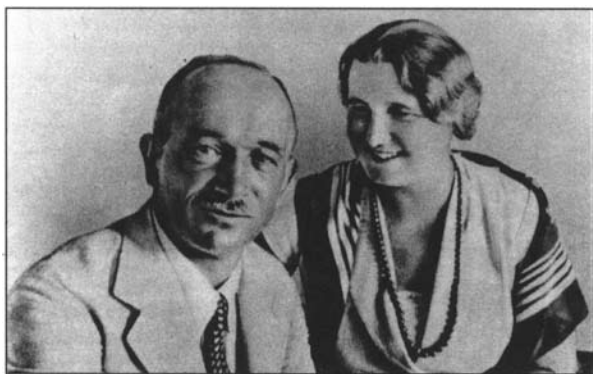
Eduard Beneš z ženo.

Kto bol kto za I. ČSR. Q111, Bratislava 1993.