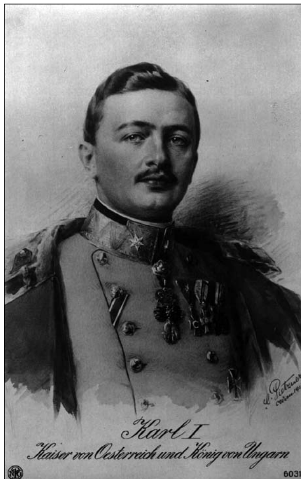
Karel I. – monarh brez cesarstva.

Zahvaljujoč spretnosti Ottove matere Zite je družina kmalu po Karlovi smrti uspela zapustiti atlantski otok in se vrniti v Evropo. Najprej je našla zatočišče v Španiji, nato v Belgiji. 5 Na morebitno vrnitev na Dunaj ni bilo upati, saj je avstrijski parlament kmalu zatem, ko se je cesarska družina vkrcala