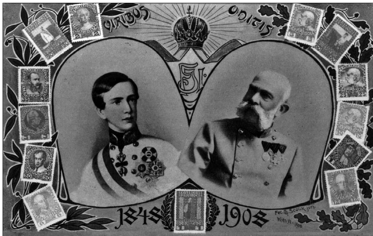
Franc Jožef I. – vladar z osemindesetletno delovno dobo (1848-1916).

predstavljal samo eno od nasledstvenih držav bivše Avstro-Ogrske. Na evropskem političnem zemljevidu po prvi svetovni vojni je bila nov subjekt bledega vpliva. Poleg tega se je republikanska »Rest-Österreich« v prvih povojnih letih tudi soočala s premnogimi gospodarskimi težavami. Ena najbolj elegantnih rešitev zanjo bi zato bila po mnenju večine avstrijskih političnih strank priključitev k nemški državi. Zagovarjali so jo socialdemokrati, Velikonemci in Landbund ter tudi del krščanskih socialcev. Senžermenska mirovna pogodba, ki je jeseni 1919 med drugim prepovedala priključitev Avstrije k Nemčiji, je sicer navzven opravila s to problematiko, vendar perečih diskusij o tej temi ni mogla preprečiti. 7