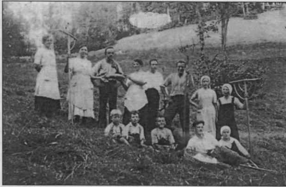
Košnja - Ponikve okrog leta 1927