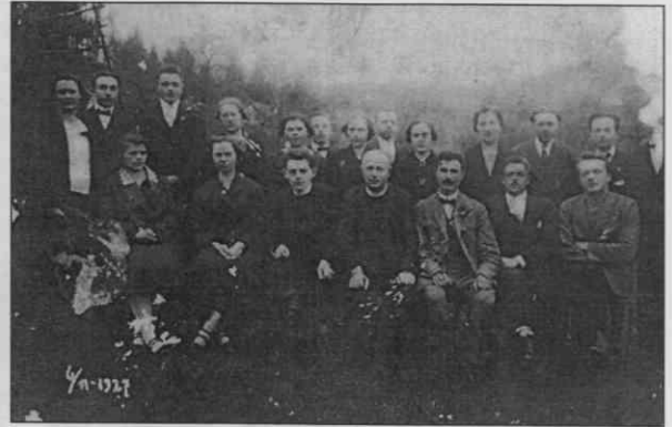
Člani prosvetnega okrožja ob eni izmed prosvetnih tekem

ke. 186 Vsak razdelek zase je skrbno oblikovan, vprašljiva pa je njihova razporeditev, Vsekakor so najbolj pomembni med njimi tisti, ki se opirajo na avtentične terenske vire in je tako avtorica otela gotove pozabe veliko vaškega izročila.