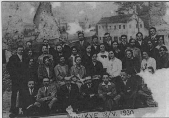
Člani ponikovskega bralnega društva pred kuliso narejeno za eno izmed iger

se glede italijanskega škornja strinjala. Kje se to kaže bolj kot v pesmi. Zveni nenavadno, a je res, da je tudi oče napisal pesem, ko so ga 20. oktobra 1918 zaprli v Podbrdu v Baški grapi, ko je bil namenjen na Jesenice po hrano za otroke, ki jim je umrla mati, njegova žena. 70