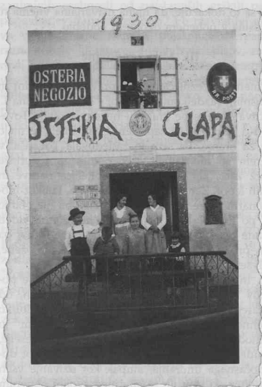
Gostilna in trgovina Lapanje leta 1930