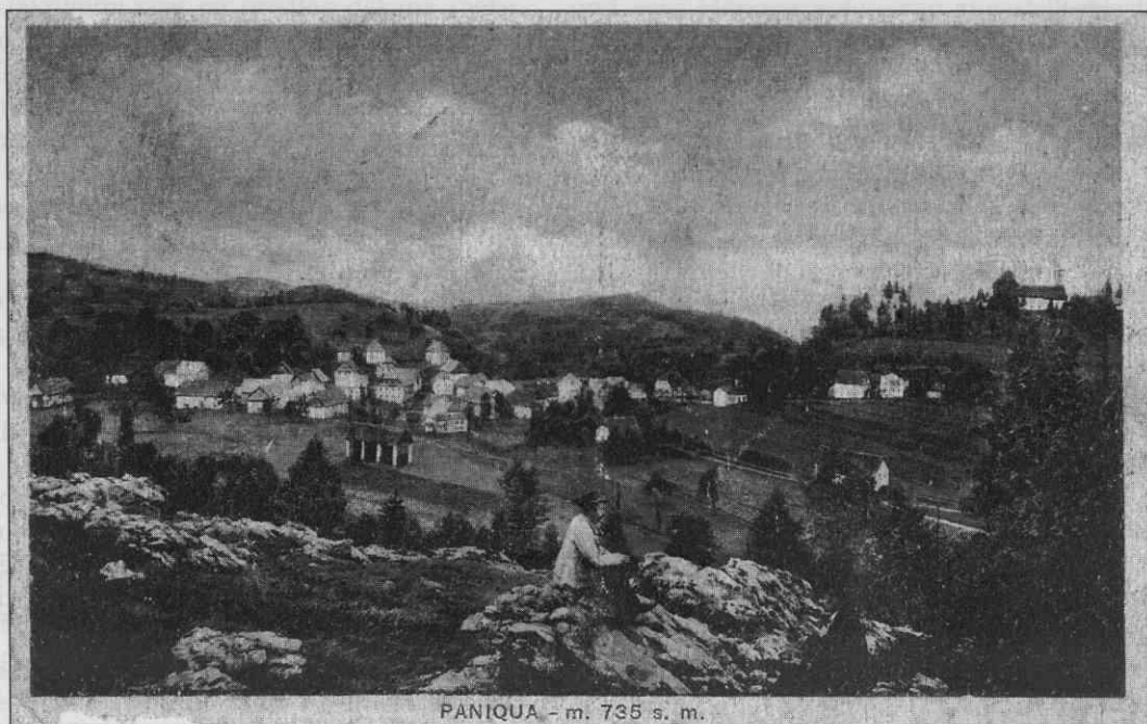
PANQUA - m. 735 s. m.

pričana sem, da so mnogi veliko več pretrpeli od mene. Ali vsak zase najbolje ve sam. - Glavni namen mojega pisanja je ta, da bom dala na papir vse, kar sem doživela in preizkusila v mojem življenju do sedaj. Sedaj imam popolnoma svež spomin. Mogoče preveč. Skušala bom opisati vse čim bolj avtokritično. Da ne bo pri tem kakega hvalisanja in tudi ne prestrogega gledanja. 9