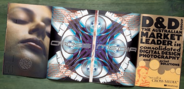
Naslovnica in štiri notranje strani nagrajene brošure.