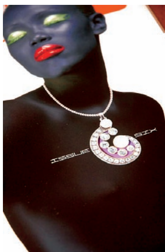
Lasersko izdelan detajl na naslovnici.