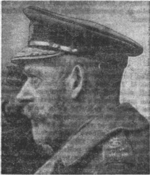
Angleški kralj Jurij V., ki je v starosti 70 let v torek 21. t. m. umrl.

V noči od ponedeljka na torek tega tedna je umrl angleški kralj Jurij. Že pred nekaj leti je kralj težko obolet in so s strahom pričakovali najhujšega. Toda kralj je ozdravel in ves angleški narod je bil vesel. To pot je bila bolezen močnejša. Angleški prestol bo zasedel najstarejši sin princ Waleski.