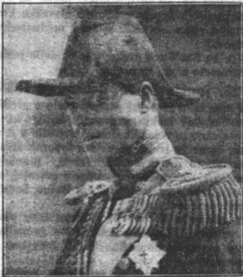
Edvard, princ Waleski, ki bo po očetovi smrti zasedel prestol velikobritanskega imperija.

postala spricho laških vojnih podvigov nemirna. Kajti njej zapreti ali okrniti pot v Indijo, pomeni toliko kakor uničiti njeno svetovno gospostvo. Zato je bila vsa Anglija, oziroma vse