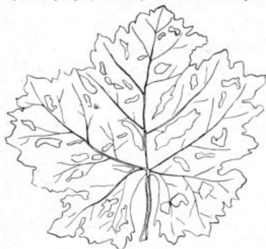
Slika 46. Objeden list vinske trte.

Nas zanima predvsem uspešno zatiranje tega škodljivca. Kakor pri vseh živalskih škodljivcih, je tudi tu mehanično zatiranje (ročno obiranje posebno v jutranjih urah) najvažnejše opravilo, in to junija do julija meseca, ko hrošči letajo. V