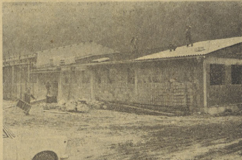
OD TEMELJNEGA KAMNA DO STREHE KRATEK ČAS: brusilnico v Kozjem bomo kmalu izročili njenemu namenu

5. Avtomatska zmesarna: napravljen je investicijski program. Prav tako so zagotovljena tudi sredstva v okviru bančne tranše v letu 1974.