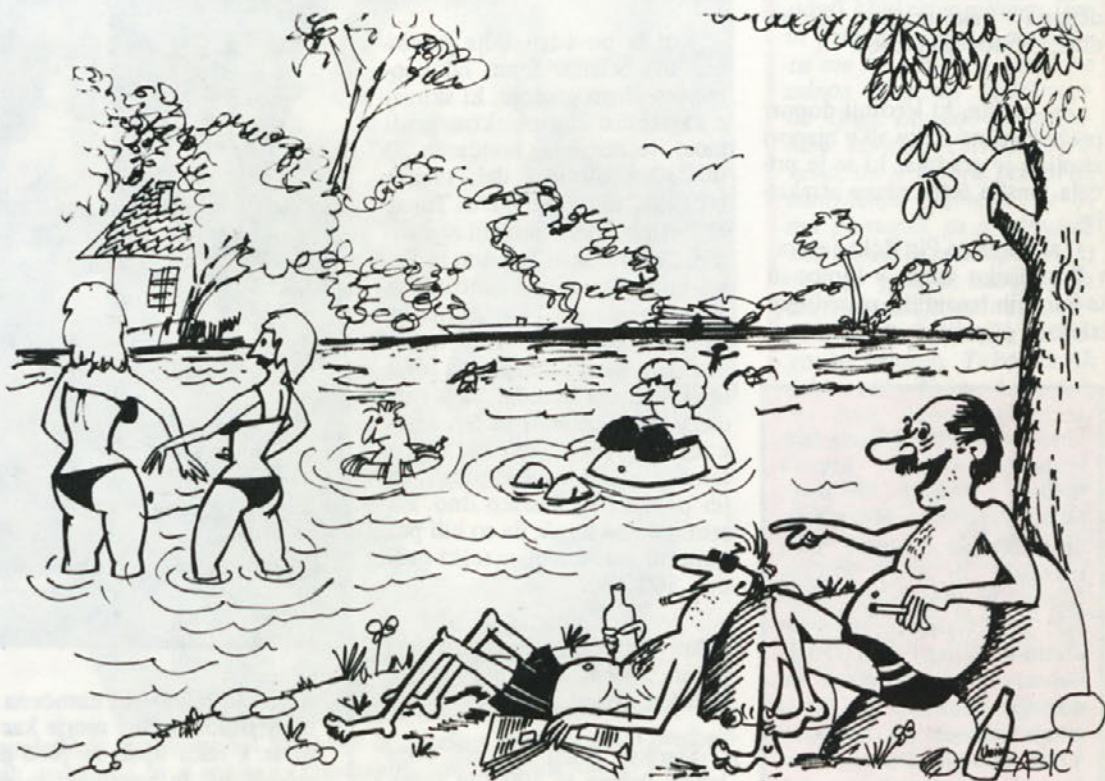
– Dekleta, ki delajo v „Beti“, imajo vsak dan drugačen bikini . . .