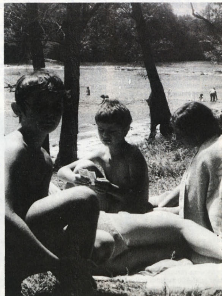
Kolpa je te dni kot naročena za kopanje in zato imajo otroci iz metliške občine morje kar doma. Tisti najbolj korajžni, ki so se v reko upali že pred dvema mesecema, so se kopanja nekolikanj že naveličali in počitniški dolgčas si preganjajo tako, kot naša „četvorka“ na sliki.

Stanko Šram: „Veli Joža lahko dvigne le 300 ton težek tovor. Zaro smo temeljni blok izdelali iz betona na mauni