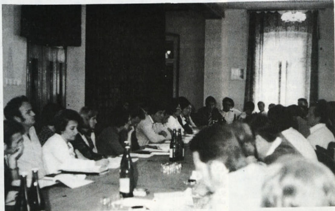
Preddopustniška seja delavskega sveta je bila na Vinomerju pri Metliki 1. julija. Delegati so govorili veliko tudi o planski in delovni disciplini. Kakršna koli odstopanja od sprejetega bo šteti za hujšo kršitev delovnih dolžnosti.