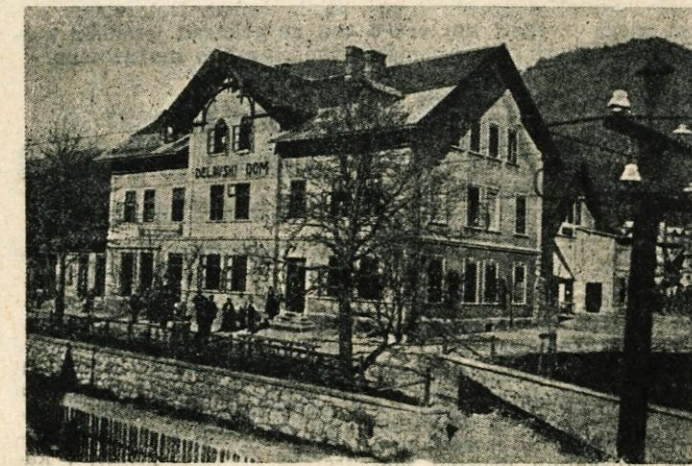
Delavski dom na Jesenicah, kjer so se zbirali predvojni svobodaši in ki je še danes center delavskega kulturno-prosvetnega društva »Svoboda«