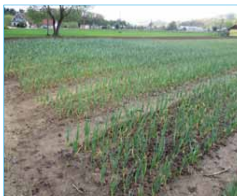
V jeseni česen ne bi smel zrasti tako velik

Gredico ali njivo pripravimo vsaj 10 dni pred sajenjem, saj česen zahteva dobro pripravljeno zemljo. Na tak način lahko mehansko uničimo tudi prve plevele, ki vzkalijo še pred sajenjem česna. Ker potrebuje ves čas rahlo zemljo, si zagotovimo dovolj prostora za rahljanje tal, med vrstami naj bo vsaj 30 cm, v vrsti pa 5–8 cm. Globina sajenja je v jeseni 8 cm, spomladi pa 4–5 cm. Na večjih površinah ga lahko sadimo strojno, nikakor pa se ne mučite z ročnim potikanjem stročkov. Enakomerno bodo vzkalili tudi, če bodo padli poševno ali vodoravno v jamice, samo da se popolnoma ne preobrnejo. Prezimne sorte sadimo v zadnjem tednu oktobra in prvem tednu novembra, mogoče samo kje na višjih nadmorskih višinah nekaj prej. Sadimo ga lahko vse do takrat, ko zemlja zamrzne. Zadnji rok sajenja prezimnih sort je januar, vendar