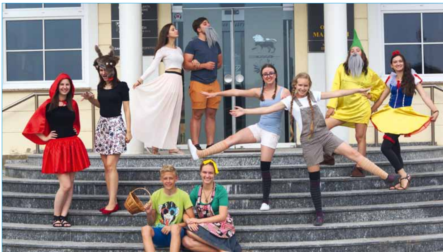
7. mladinski glasbeni tabor je minil v znamenju pravljic. Animatorji so izbrali svoje najljubše pravljicne junake. Uganete, katere?