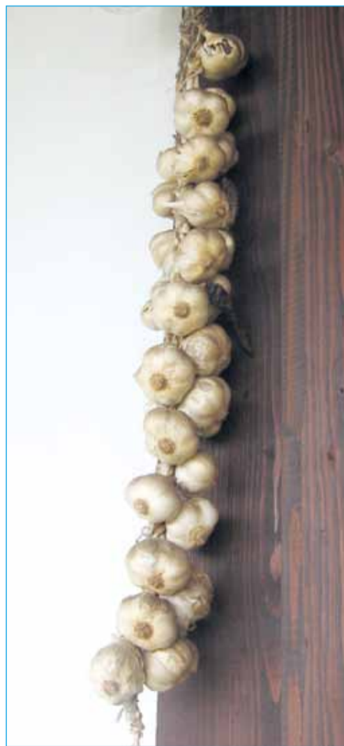
Česen hranimo v suhih prostorih pri temperaturi okoli 0 °C.

Česen lahko gnojimo z dobro prepereлим domačim kompostom (1,5–2 l/m 2 ). Lahko uporabimo tudi kupljena organska gnojila, na vrtu bo povsem zadostovala polovična priporočena količina. V primeru slabše (B) založenosti tal s kalijem, mu dodamo 2–4 kg gnojila kalijev sulfat na 10 m 2 . Ko ima česen 4–5 listov, ga dva- do trikrat zalijemo z namočenimi koprivami ali pa kupimo tekoče organ-