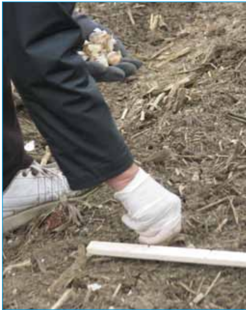
Sajenje česna, stročkamo tik pred tem

V zadnjih dveh letih smo Slovenci le odkrili pomen in vrednost doma pridelane, sveže zelenjave. K temu je pripomoglo tudi spoznanje, da slovenskega česna na policah slovenskih trgovin sploh ni. Nekoč so bili česen, čebula, fižol in solata prav na vsakem vrtu, veliko česna pa so pridelali tudi pridelovalci na svojih njivah. Vendar slovenski česen seveda ne bo mogel konkurirati nizkim cenam tistega, ki k nam prihaja iz Azije. Prav zato je vedno več vprašanj, kako česen pridelati na svojem vrtu.