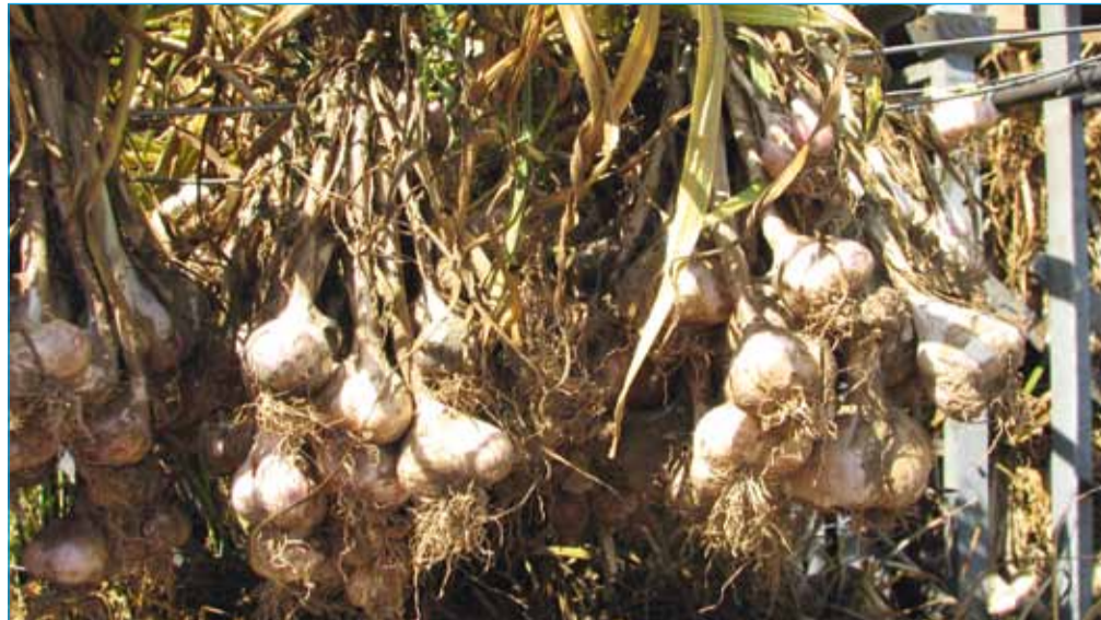
Česen je najbolje sušiti z listi vred, obešenega v senci