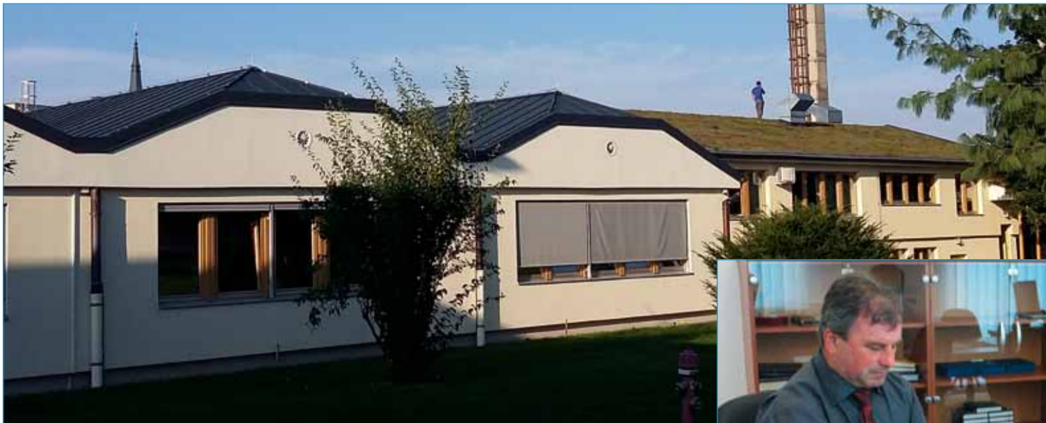
Nova streha Osnovne šole Markovci

Poletje se počasi posavlja in na vrata že trka jesen. 1. septembra je Osnovna šola Markovci spet odprla svoja vrata vedoželjnim otrokom. Novo šolsko leto je prineslo nekaterim učencem nove učitelje in šolske predmete, največje spremembe pa doživljajo tisti, ki so vrtec zamenjali za šolo. Spremenila se je tudi šolska stavba, ki je bila zgrajena leta 1979. Markovska šola, »lepotica« med osnovnimi šolami, je bila tedaj prva osnovna šola v tujski občini, zgrajena iz sredstev samoprisp evka. Tehnologija in gradbeni načrti tistega časa pa še niso omogočali gradnje energijsko varčnih objektov, zato so stroški ogrevanja šole iz leta v leto naraščali. Leta 2013 se je Občina Markovci kot ustanoviteljica odločila za energetsko sanacijo šolske zgradbe v vrednosti več kot pol milijona evrov. Ker pa se investicijsko vzdrževanje zaradi visoke finančne obremenitve investitorja praviloma opravlja v daljšem časovnem obdobju in