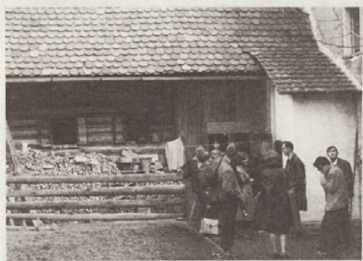
Jeseni leta 1962.