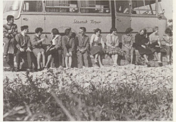
Ekskurzija v Istro, 1960.

smo zoreli, lažje smo ga razumeli. Že spočetka pa nam je bilo jasno, da mu ni vseeno za nas in da je etnolog s srcem in dušo. Načelen, klen, iskren. Malo je ljudi, ki tako trdno stojijo za svojimi načeli, jih argumentirano zagovarjajo in se ne obračajo po vetru. Kot takšen nas je naučil še mnogo več, kot zgolj zapletenih etnoloških resnic.