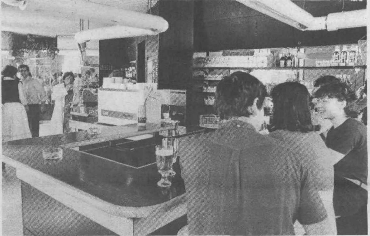
V zadnjem času so v občini Center odprli več novih manjših lokalov, kjer gostje lahko dobijo marsikaj: od pleskavic in lepinih do sladoleada in seveda različnih pijač. Sodobno opremljeni lokalčki so tako popestrili gostinsko ponudbo v naši občini, kar dokazuje tudi pogled v Brucar na vogalu Gregorčičeve ulice.