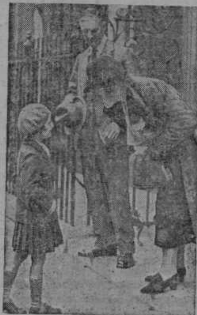
Zakonskemu paru Chamberlain se zahvaljuje sedemletna deklica za mirno rešitev sudetskega vprašanja in za odvrnitev nove svetovne vojne.