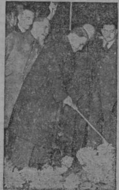
Francoski ministrski predsednik Daladier na grobu neznanega vojaka v Parizu ob priložnosti velikih manifestacij za mir.