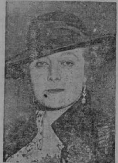
Gospa Chamberlain, soproga angleškega ministrskega predsednika, je znatno podpirala svojega moža pri delu za mir v Evropi.