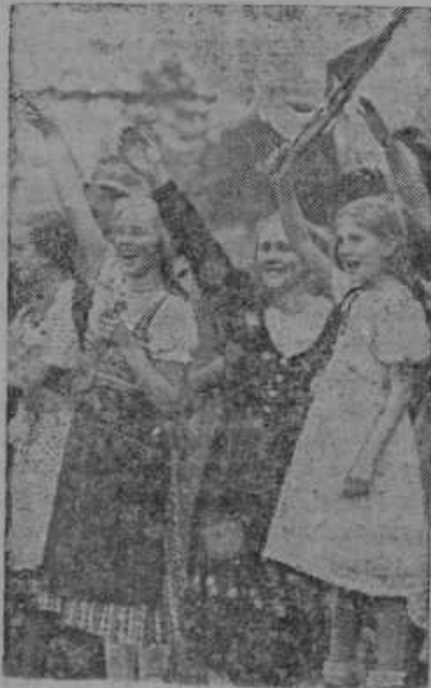
Ženski svet pozaravlja nemško vojsko pri vstopu v sudetsko-nemško pokrajino.