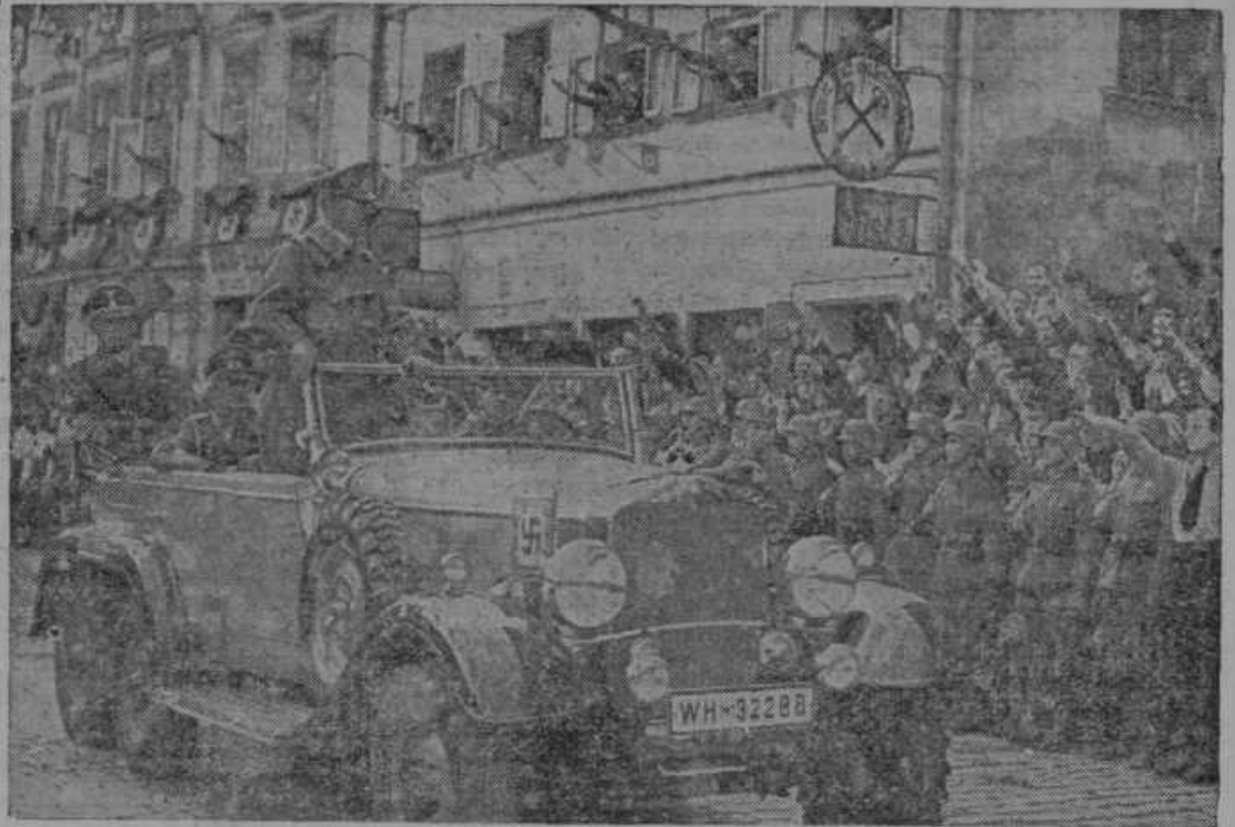
Sprejem Hitlerja v sudetskem mestu Asch.

Pišcece. Dne 22. septembra je minula prva obletnica smrti našega ljubljenelega gospoda župnika, kateri se je lani 20. septembra na potu v Brežice smrtno ponesrečil. V obilnem številu smo se zbrali ta dan pri sv. maši, katera je bila darovana za njegov dušni blagor. Tudi sv. obhajilo smo darovali v ta namen ter se ga spominjali v molitvi. Po sv. maši smo obiskali njegov grob, katerega že krasi lep spomenik z njegovo silko. Na grob smo položili vence iz belih lilij. Ko smo na grobu opravili tihe molitve, smo še obstali ter se zamislili v preteklost, zamislili smo se v čase pred 19 leti, ko je blagi rajni gospod župnik začel orati celino v naši župniji. Globoko je zastavil plug ljubezni in požrtvovalnosti. Ni se ustrašil nobenih zaprek in žrtev. Globoko je znal pogledati v dušo vsakega in ga z ljubeznijo odvrniti od njegove krive poti. Posebno lepo je obdelal mladinsko polje, katerega že sedaj, eno leto po njegovi smrti, ob pomanjkanju duhovnega delavca prerašča plevel mlačnosti. Zato smo ta dan tako iskreno prosili na njegovem grobu, naj bi se pri Bogu spomnil in prosil za našo zapuščeno župnijo.