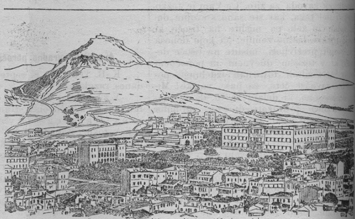
Das moderne Athen mit dem Königsschloss.

Kakor znano, je Grška zdaj od naših sovražnikov skoraj popolnoma podjarmljena, ker njen kralj — svak nemškega cesarja — ni hotel prelomiti svoje besede. Angleži in Francozi so deloma že zasedli glavno mesto Grčije, staro-davno prestolico Atene, katere sliko prinašamo. Atene so od leta 1835 sem glavno mesto Grške.