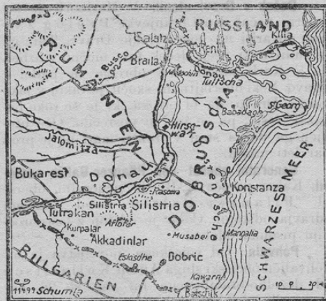
Der Vormarsch der Bulgaren

Z ozirom na bolgarsko-nemško prodiranje v pokrajini Rumunije med Črnim morjem in