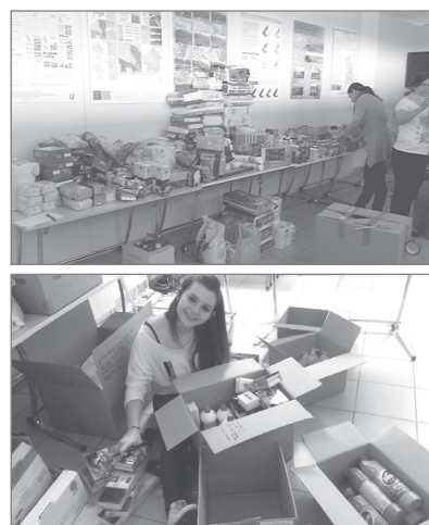
Sliki 4 in 5: Spremenjena funkcija knjižnice urbanističnega inštituta