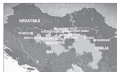
Slika 1: Površina poplavljenega območja

Pomoč, ki smo jo zbrali na urbanističnem inštitutu in v sodelovanju z valdorfsko šolo, se je merila v tonah.