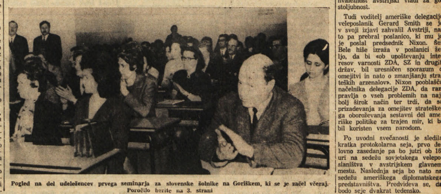
Pogled na del udeležencev prvega seminarja za slovenske šolnike na Goriškem, ki se je začel včeraj. Poročilo berilca na 3. strani