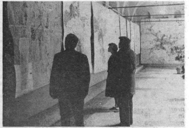
Javna razgrnitev načrtov o razvoju Ljubljane do leta 2000 v spodnjih prostorih Magistrata naj bi dala možnost vsem prebivalcem našega mesta, da podajo svoje pripombe in predloge