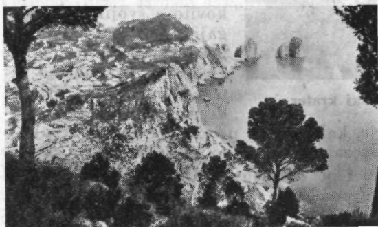
Otok Capri z otočki Faraglioni

Izletniški brod je krenil po modri gladini iz Neapeljskega zaliva proti skalnatemu otoku. Za ladijskim vijakom sta se belo kodrala dva velikanska valova, izhajajoča izpod broda, ter se vedno bolj širila. Beli galebi so s krikom obletavali brod ter sedali na razpenjene valove, kakor bi nekaj iskali.