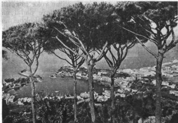
Neapelj — luka, nekoč ognjeniški krater

gih in ulicah lahko kupiš cele veje, kakor dobiš pri nas na kmetih češnjevo vejo s češnjami, ali pa jeseni odrezano trto, polno grozdja.