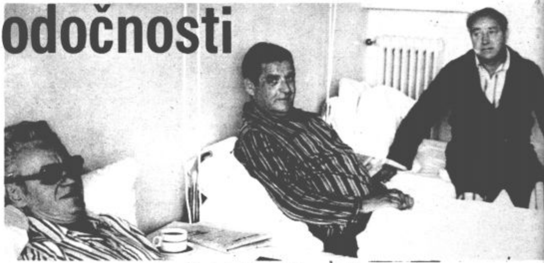
V eni od sob na pljučnem oddelku

Trenutno so tu le pacienti iz velenjske in mozirske občine z indikacijami pod A ali B. Z