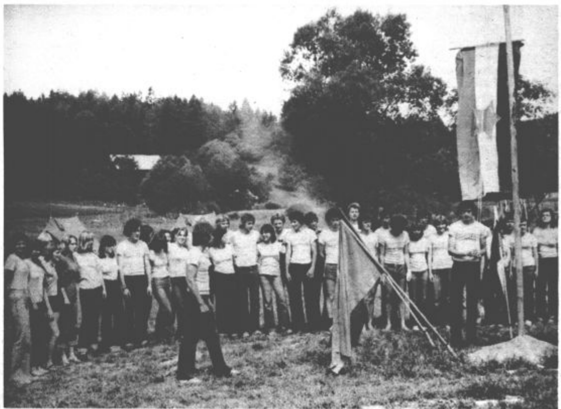
Še zadnji spust zastave

čanom pri urejanju okolice doma družbenopolitičnih organizacij.