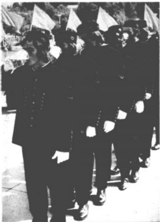
Po že tradicionalni knapovski navadi so morali mladi rudarji najprej stopiti na sodček in z obljubo, da bodo ostali zvesti rudarskemu poklicu, skočili v rudarski stan. Nato so tudi z vrčem piva, ki so ga spili na dušek, potrdili, da so postali pravi rudarji.