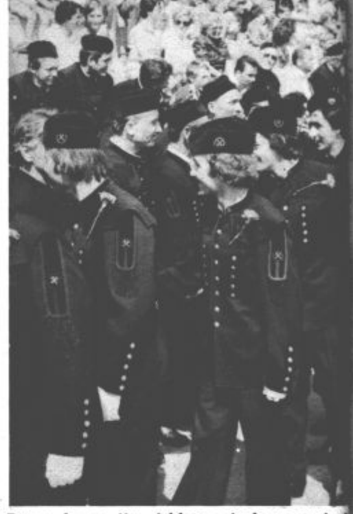
Potem ko so jim dekleta pripela na prsi nagelj kot znamenje ljubezni, in ko so pred ključ ter rudarsko svetilko predstavnikom druga letnika, so novosprejeti rudarji stekli na ploščad kotalkališča na tribuno, kjer so jih sprejeli rudarji s krepkim stiskom roke sprejeli rudarski stan.