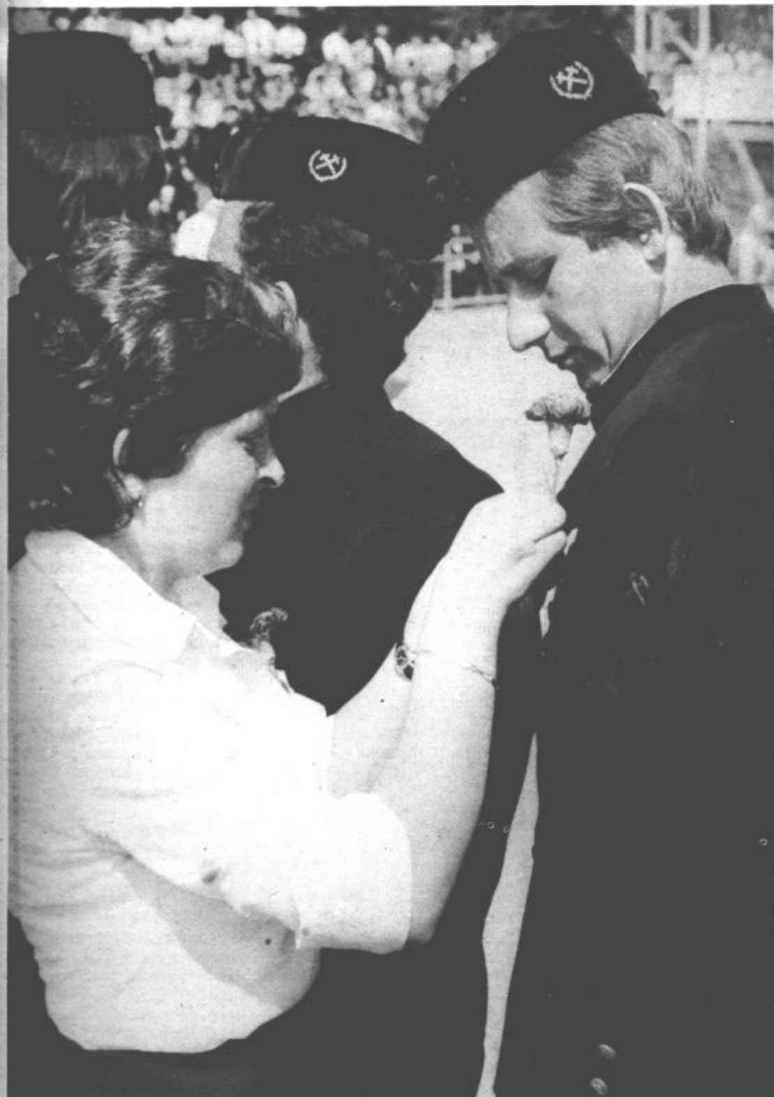
Dekleta so jim pripela rdeče nageljne kot znak ljubezni

O tem, kakšna bo prihodnja samoupravna podoba termoelektrarne Šoštanj in rudarsko elektroenergetskega kombinata Velenje, pa so v šoštanjski termoelektrarni že spregovorili zbori delavcev. Na prvem referendumu, ki je bil 29. junija, je večina zaposlenih v termoelektrarni Šoštanj soglasala s predlogom, da se sedanja delovna organizacija Rudarsko elektroenergetski kombinat Velenje reorganizira v sestavljeno organizacijo združenega dela. Ob tem pa ne gre prezreti tudi javo izražena interesa delavcev termoelektrarne Šoštanj, da združujejo delo in sredstva tako v okviru sestavljene organizacije združenega dela REK Velenje, kot v okviru sestavljene organizacije združenega dela EGS.