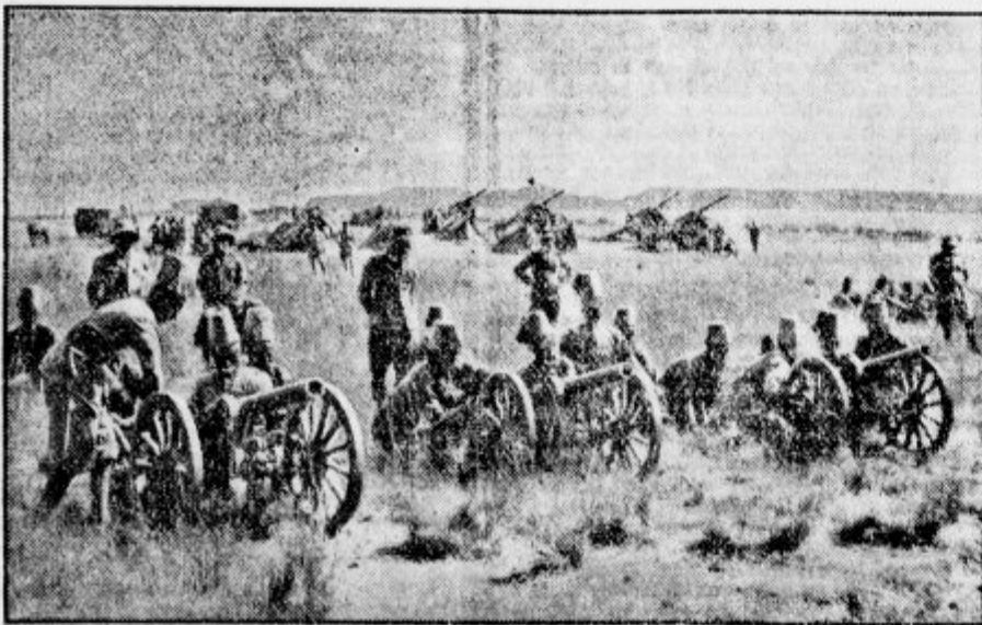
Italijansko topništvo na severni abesinski fronti. Baterija 7 cm poljskih topov. Topničarji so sami črni askarije. Zadaj stoji baterija težkih topov.