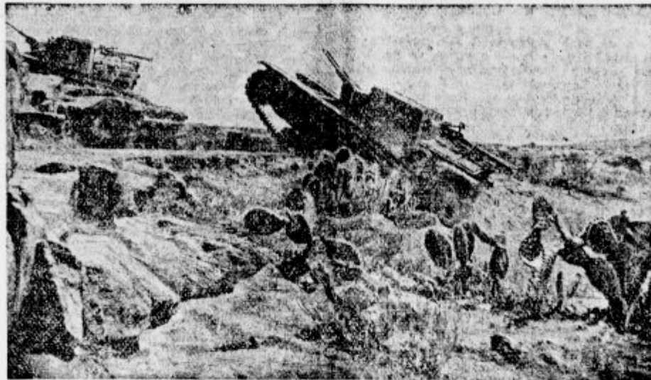
Italijanski tanki na severni abesinski fronti prodirajo med kaktusi in skalovje.

Stara afriška navada je, da zmagovalcev zavzeto trdnjavo sme temeljito oplentiti. To so Angleži tudi temeljito storili, še preden so trdnjavo zapustili ostanki potolčene abesinske armade, cesarjeva družina in 20.000 žena, ki so prišle s svojimi možmi — abesinskimi vojaki. Z Angleži je tedaj bil tudi nemški afriški raziskovalec Rohlfs, ki se je udeleževal vseh bojev od početka. Ko so angleški vojaki oplentili Mag-