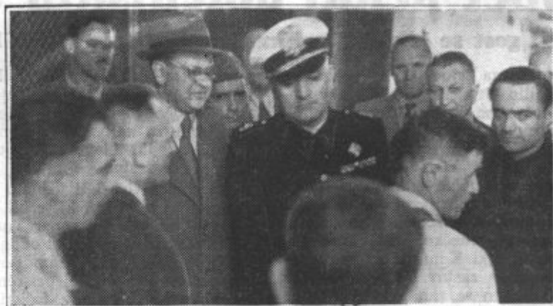
Visoki Komisar se pogovarja z delavskimi zaupniki v pivovarni Unionu