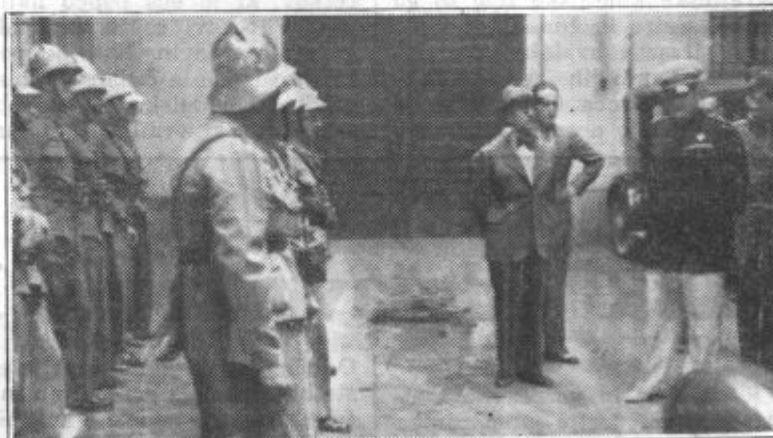
Ekscelenca Grazioli govori gasilcem v Mestnem domu