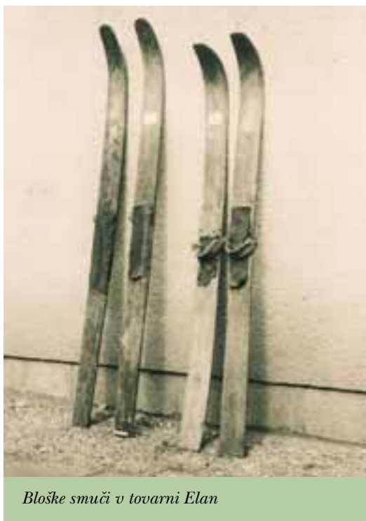
Bloške smuči v tovarni Elan

Wd tkrt je minilo že duosti let, bi rekli Gorjani. O silovitem napredku smučanja in opreme ni vredno izgubljati besed. Smuči že davno niso več nepogrešljiva zimska delovna oprema gozdarjev in lovcev. Z njihovo uporabo je seznanjen domala vsak otrok, še preden se nauči branja in pisanja, les in usnje so zamenjali živopisani umetni materiali, ki ustrezajo dandanašnjim smučarskim šegam