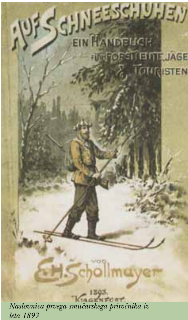
Naslovnica prvega smučarskega priročnika iz leta 1893

in navadam. Na lesene »dilce« bi lahko naleteli le še v kakšnem pajčevinastem kotu kleti ali pa v muzejih, skupaj s porumenelimi fotografijami iz pionirskih časov smučanja, če ne bi bilo navdušencev posebne vrste. Ker je to malo daljša zgodba, bo treba ponovno poseči v zgodovino.