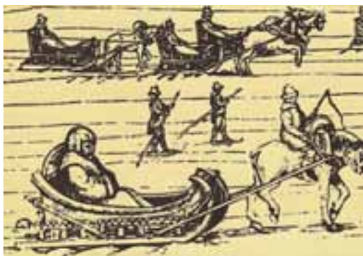
Iz Herbersteinovih Moskovskih zapiskov, smučanje v pokrajini Perm

Najstarejše smučiči segajo v čas okoli 3500 let pred našim štetjem. Smučiči so se po obliki in dolžini med seboj in v primerjavi z današnjimi seveda precej razlikovale, vse pa so imele skupni namen: olajšati hojo po snegu. Tako so jih v zgodovini kmalu koristno uporabili tudi za vojne namene: prvi zapis o tem, da je smučič – v bitki za Oslo – uporabljala vojska, sega v leto 1200. Prav švedsko-norveška vojna v začetku 18. stoletja pa naj bi imela veliko zaslug za nadaljnji razvoj smučanja, saj je v njej delovala posebna enota 2000 norveških vojakov na smučeh, večinoma prebivalcev doline Telemark. Po vrnitvi domov so še naprej gojili smučanje in ga širili med prebivalci; ti so ga zanesli tudi v Oslo, kjer sta se začeli množična izdelava in prodaja smučarske opreme, od tam pa se je do sredine 19. stoletja razširilo na vso Norveško. Prvo smučarsko tekmovanje na svetu je potekalo leta 1843 v norveškem Tromsøju, zmagovalec pa je bil Laponec, ki je 5 kilometrov dolgo progo pretekel v 29 minutah.