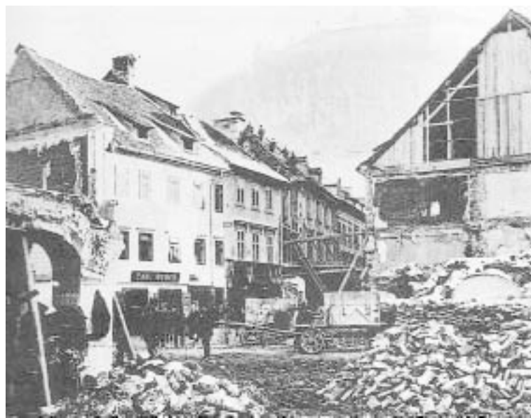
Rušenje hiš v sedanji Stritarjevi ulici v Ljubljani, poškodovanih v velikonočnem potresu leta 1895

ko je bilo vse področje pod šempetrsko prafaro, so tu sezidali osemkotno krstilnico verjetno zato, ker je bilo do Ljubljane predaleč, da bi tja prinašali otroke h krstu. Prvi zapisani podatki sežejo v leto 1228, a krstilnica-cerkvica je verjetno stala že prej. Kasneje so jo povečali v običajno vaško cerkvico. Ob popraviljanju v drugi polovici lanske-