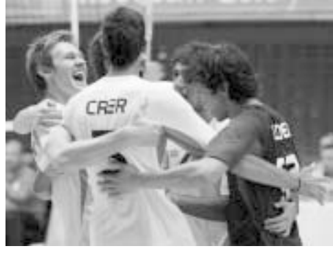
Veselje ob dobljeni točki

južnoameriška olimpijada pod imenom Juegos Odesur. Argentina je številno bila zastopana v skupinskih in tudi posameznih športih.