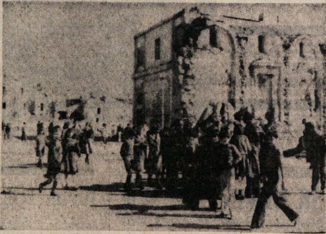
Prizor z glavnega trga Sante Ninfie v dolini reke Belice, ki jo je 1. 1968 opustošil potres. Preživeli so že devet let prebivali v zaslišnih barakah

Ne moremo seveda mimo polnočnice papeža Pavla VI. v cerkvi Sv. Petra, sicer pred baročnim oltarjem nad grobnico sv. Petra, ki jo je televizija predvajala daleč po svetu. Sveti oče je izrazil zadovoljstvo s pečo ugodnega poteka egipčanske - izraelske pogajanja za pomiritev na Bliznjem vzhodu ter potrebo, da zavladata na svetu čimprej resnični mir in pravico. V