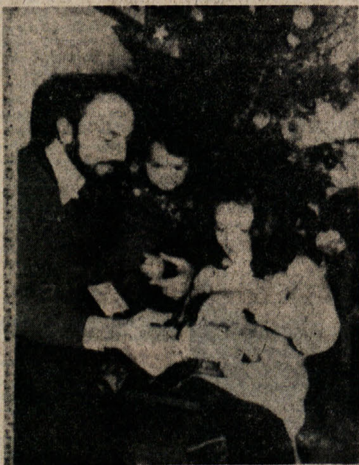
Elektronski inženir Franco Malerba iz Milana, ki je bil v strogi konkurenci izbran za prvega italijanskega kozmonavta, je pripravil nečaku in nečakini pristočno božično darilo: pod drevescem sta našla model vesoljske ladje «spacelaba», s katero se bo leta 1980 v družbi drugih evropskih ter ameriških avstronavtov popeljal na krožni tir okoli zemlje