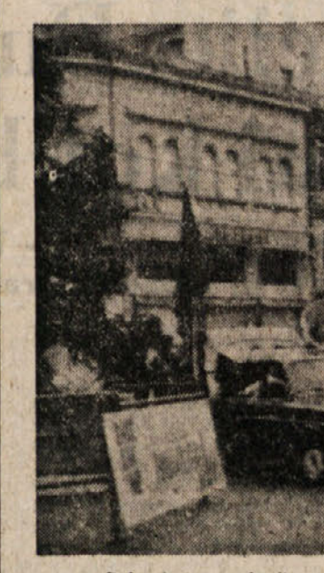
Delavci so se zbrali v nedeljo zjutraj na tržiškem Trgu republike in si izmenjali voščila

Na božični dan so se zbrali na Trgu republike v Trzinu in opozarjali mimoidoče na svoj nevzdržni položaj