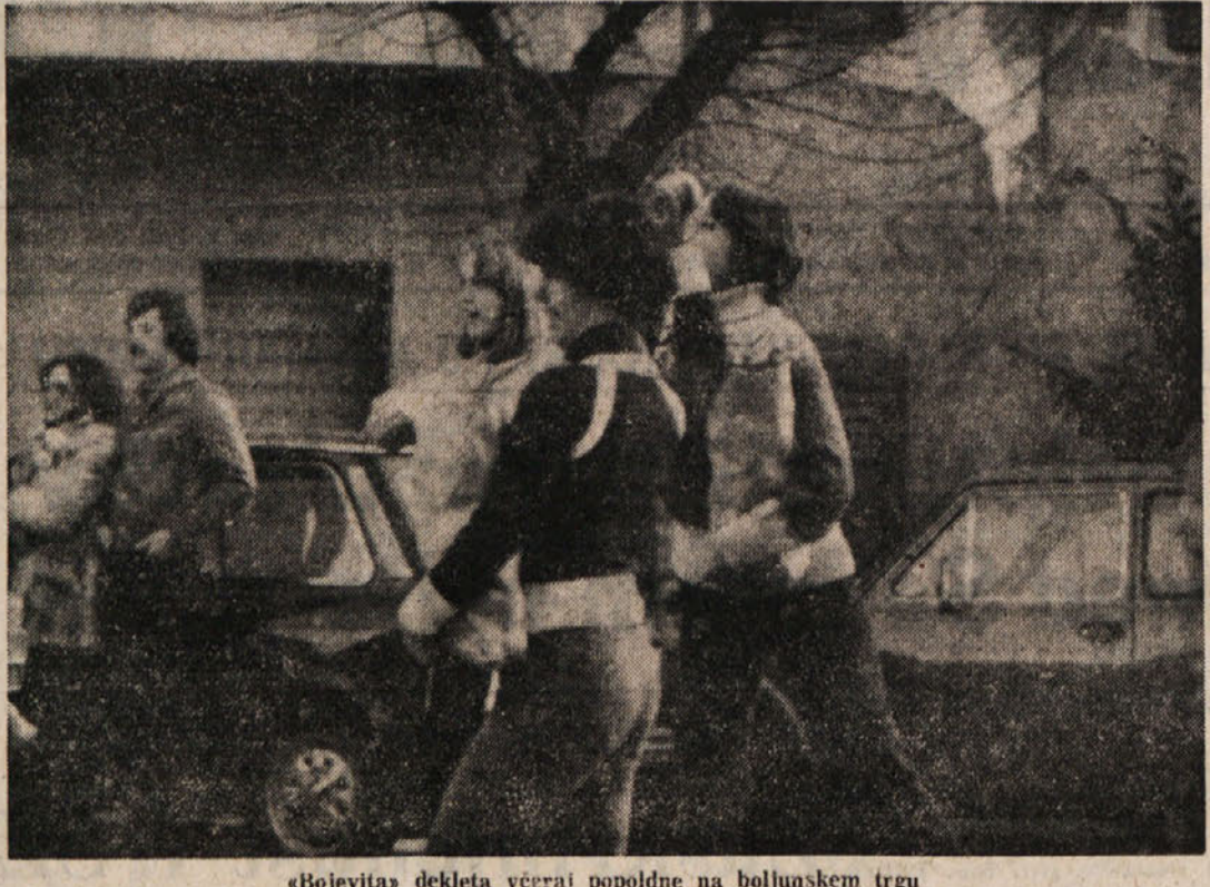
«Bojevit» dekleta včeraj popoldne na boljunškem trgu