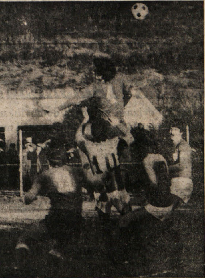
Zaradi božičnih in novoletnih praznikov je počitek tudi v 2. nogometni amaterski ligi. Na sliki: posnetek s slovenskega derbija v Bazovici med domačo Zarjo in Bregom. V tem srečanju so slavili Bazovci

FIRENCE - Na boksarski prireditvi, ki je bila včeraj v tem kraju, je v srednji kategoriji Sandro Maz