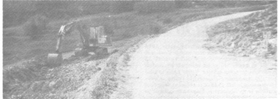
Široka in lepa bo nova, težko pričakovana cesta na Rakitno

30. junija sem se nekaj po 12. uri vračala iz trnovske bolnišnice mimo kina Vič do Tržaške ceste na avtobusno postajo. Ker mi je avtobus, ki odpelje s te postaje ob 12.30 uri, pred tem odpeljal, do prihoda naslednjega pa je bilo treba čakati še skoraj celo uro, sem se odločila – čeprav lokal optika Mira Krstiča na Tržaški cesti 7 zapirajo ob 13. uri – da stopim pogledat kdaj delajo. Lokal pa je bil odprt in do 13. ure je manjkalo še nekaj minut. Po skupini mladih, ki so izbirali okvirje in stekla za sončna očala in še enim gospodom