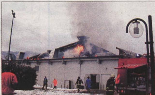
KUPOLA V OGNJENIH ZUBLJIH - Prisebnim zaposlenim gre zahvala, da so gostje termalne riviere ostali nepoškodovani, gasilcem pa, da se požar ni razširil še na druge objekte.

ZA VAS ŽE 11 LET POSLOVNI IMENIKI RUMENE STRANI SLOVENIJA TEL tel.(01) 436 53 90, fax(01) 436 85 20, www.intermarketing.si INTER MARKETING