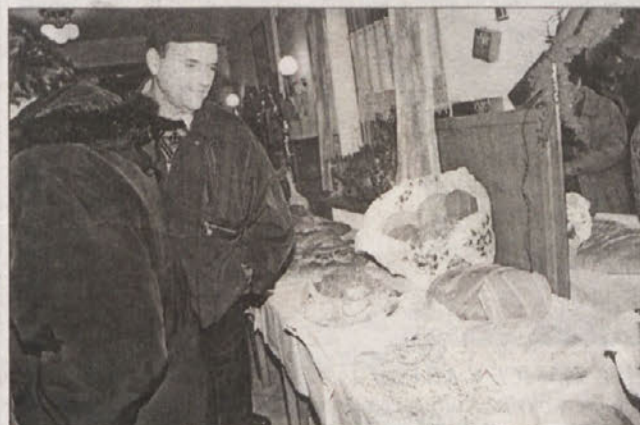
RAZSTAVA KRUHA - Obiskovalci, katerim so ob koncu prireditve postregli z domačim kruhom, so si z zanimanjem ogledali razstavo kruha v gostišču Novljan, ki so jo pripravile članice Društva podeželskih žena Mirna Peč. Prav paša za oči, res.