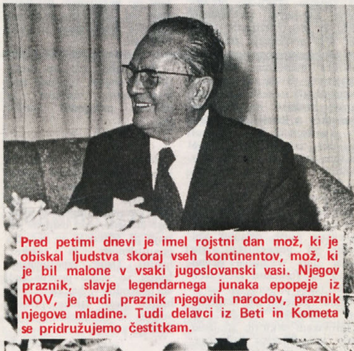
Pred petimi dnevi je imel rojstni dan mož, ki je obiskal ljudstva skoraj vseh kontinentov, mož, ki je bil malone v vsaki jugoslovanski vasi. Njegov praznik, slavje legendarnega junaka epopeje iz NOV, je tudi praznik njegovih narodov, praznik njegove mladine. Tudi delavci iz Beti in Kometa se pridružujemo čestitkam.