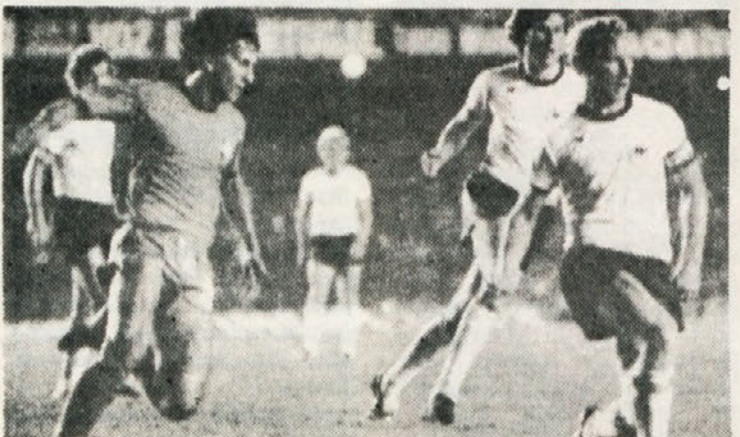
Prizor s tekme ZRN : Brazilija, ko sta se moštvi srečali na prijateljski tekmi