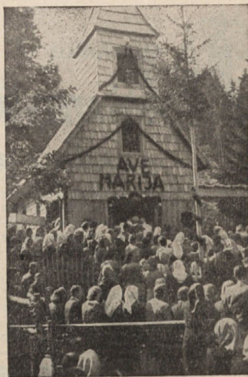
Prva božja daritev na Sedlcah pred 10 leti

Leta so minevala. Križ je trohnel in tablico sta razjedala dež in sneg. Leta 1939 je na Sajdi razsajala otroška bolezen. Spomin na nekdanjo Marijino pomoč je spet za-