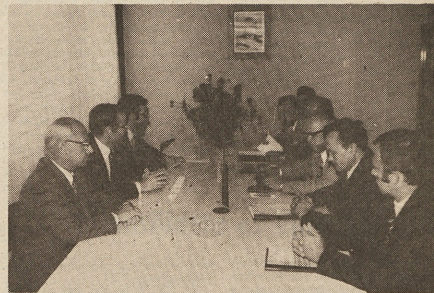
S podpisa poslovne pogodbe med Iskra Avtoelektrika in firmo Bosch.

Sodelovanje z renomiranim proizvajalcem omogoča Avtoelektriki predvsem to, da je v stalnem stiku z razvojem avtoelektričnih izdelkov v svetu, hkrati pa jo sili k nadaljnjemu izboljševanju kakovosti izdelkov. Delitev dela s firmo Bosch omogoča šempeterski Iskri — seveda pa tudi Bosch — cenejšo proizvodnjo in z njo večjo konkurenčnost na tržišču, hkrati pa vpliva na hitrejšo razširitev proizvodnega programa ter tako na zmanjševanje uvoza avtoelektričnih