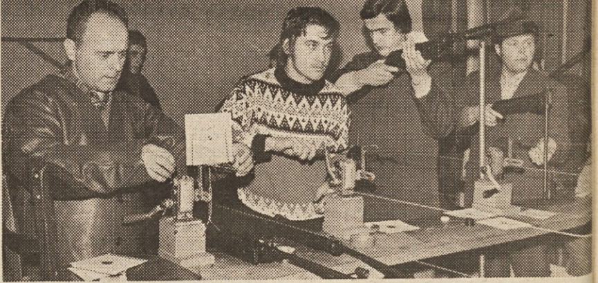
Tekmovalci kranjskih strelskih druženj in sekcij med tekmovanjem.