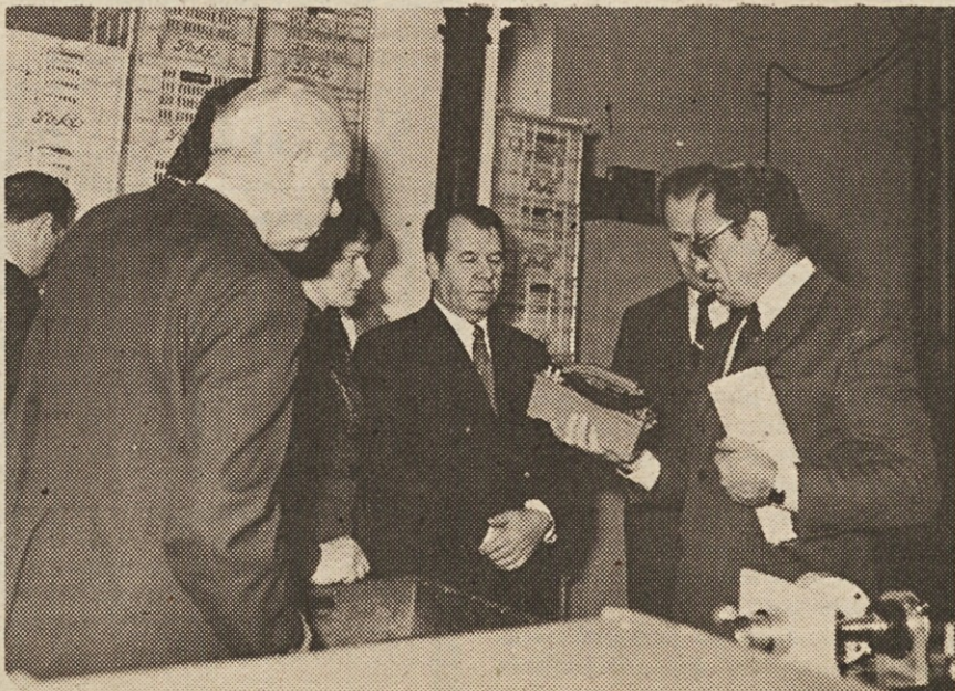
Z obiska sovjetske delegacije v Elektromehaniki v Kranju.

V okviru drugega rednega zasedanja je mešana delovna skupina SFRJ in ZSSR za radioelektroniko 25. decembra obiskala Iskrin poslovni center v Ljubljani ter tovarne Elektromehanike v Kranju. V dolgoročnem sporazumu o trgovinski menjavi med SZ in SFRJ za obdobje 1976–80 je predvidena vrednost jugoslovanskega izvoza izdelkov elektroindustrije v vrednosti 133,4 mio dol., uvoz pa naj bi po istem sporazumu znašal ca 110 mio dol. V tej strukturi bodo predstavljale glavnino jugoslovanskega izvoza telefonske centrale, uvoz pa aktivni in pasivni elementi. Po tem sporazumu naj bi Iskra izvažala tako telefonske centrale kot tudi opremo za cestno signalizacijo ter proizvodnjo elektronske industrije.