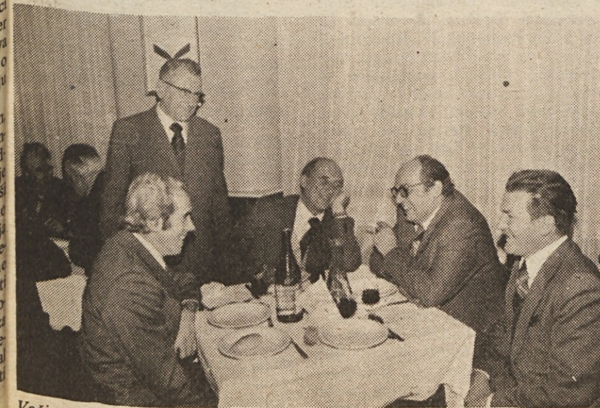
Večina pogovorov tega dne se je začela z: „Ali se še spominjaš?“ ...