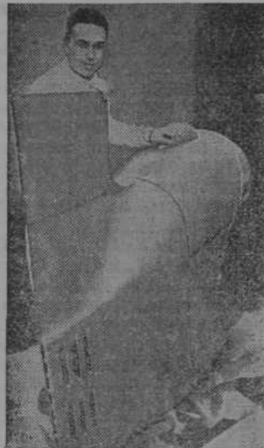
Italijanski motociklist Peter Taruffi je odnesel en dan pet svetovnih rekordov, katere je posedal poprej Anglež Guthrie. Slika nam predstavlja vozača s hitroštnim vozilom.

Očividec pripoveduje o nesreči takole: Ko so spustili iz zrakoplova vrvi za pristanek, smo videli razločno potnike, ki so nam veselo mahali iz kabine. Na krovu zrakoplova je prevladovalo kljub prestanim težkočam ter nevarnostim najboljše razpoloženje. Naenkrat je zabobnela strahovita eksplozija. Gledalci smo se razleteli na vse strani, da bi se rešili. Po preteku nekaj trenutkov smo stekli nazaj na kraj nesreče, kjer se je nudil našim očem strašen prizor. Ponosna zračna ladja je