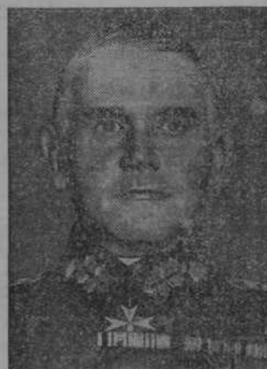
Nemški vojni minister general Blomberg bo obiskal Rim proti koncu maja.