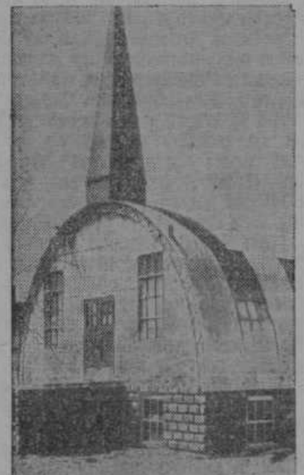
Cerkev iz jekla so zgradili v Clevelandu v Združenih ameriških državah.

Danski kraljevi par bo obhajal od 15. do 17. maja 25 letnico vladanja. Na sliki vidimo kraljico Aleksandro, kralja Kristijana in princa Frederika in Knuda.