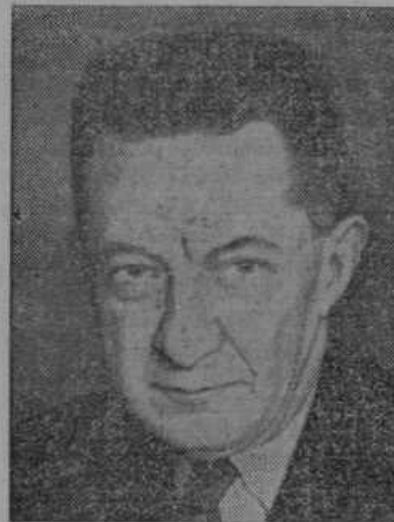
Kerenski, ruski socialist revolucionar in ministrski predsednik, je pred 20 leti zbežal iz Rusije in živi v Parizu.

V Parizu so slavili prvi maj v znamenju sovjetske zvezde.