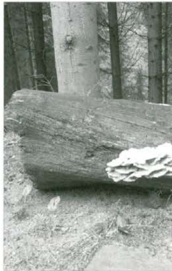
Ploh v razgradnji

Gozdarji odseka za načrtovanje (nekdanji taksatorji) v OE Slovenj Gradec so ob pomoči