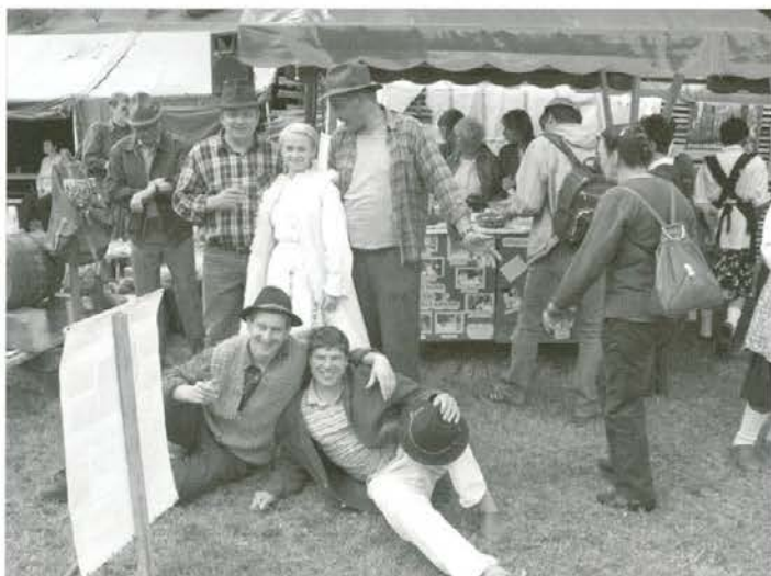
Korošci in Belokrajnka