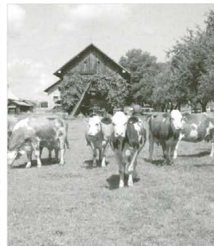
Živina na paši