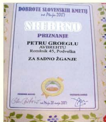
Eno izmed številnih priznanj