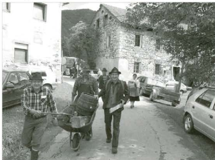
Transport rekvizitov za predstavitev študijskih krožkov iz KE Radlje v Radečah

Tudi krožkarji iz Nazarij so bili zanimivi, saj so s svojimi fotografijami na plakatih prikazali, kako so v krožku konkretno reševali probleme svo-