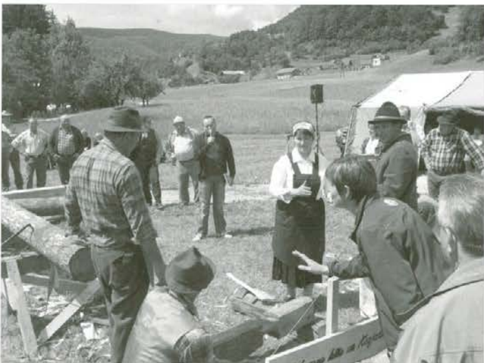
Med predstavitvijo ŠK »Lesena hiša na Kozjaku«