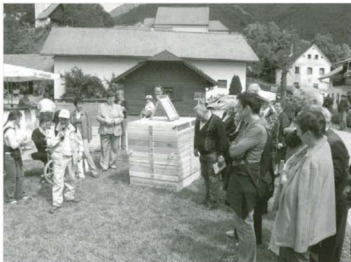
Predstavitev ŠD „Od vznika do evra“