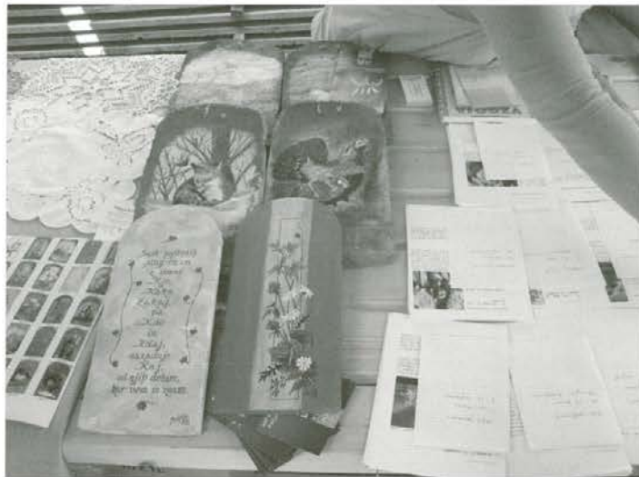
Izdelki študijskih krožkov

Udeležba na karavani je bila za vse članice krožka posebno doživetje. Bila je priložnost, da pokažemo svoje znanje in bogate izkušnje ter doživimo nova spoznanja.