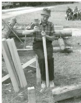
Placet Franc pri cepljenju šintlov