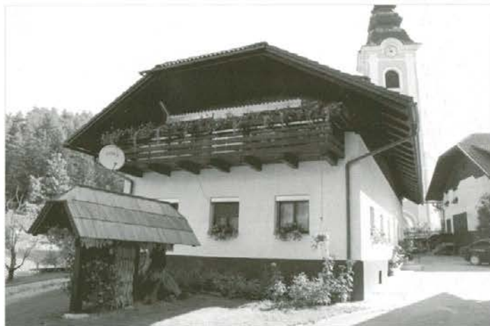
Stara hišo so obnovili tako, da so ohranili vse prvine stare arhitekture.