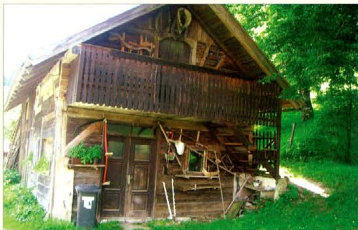
Avbrehtovi lepo skrbijo za podeželsko kulturno dediščino