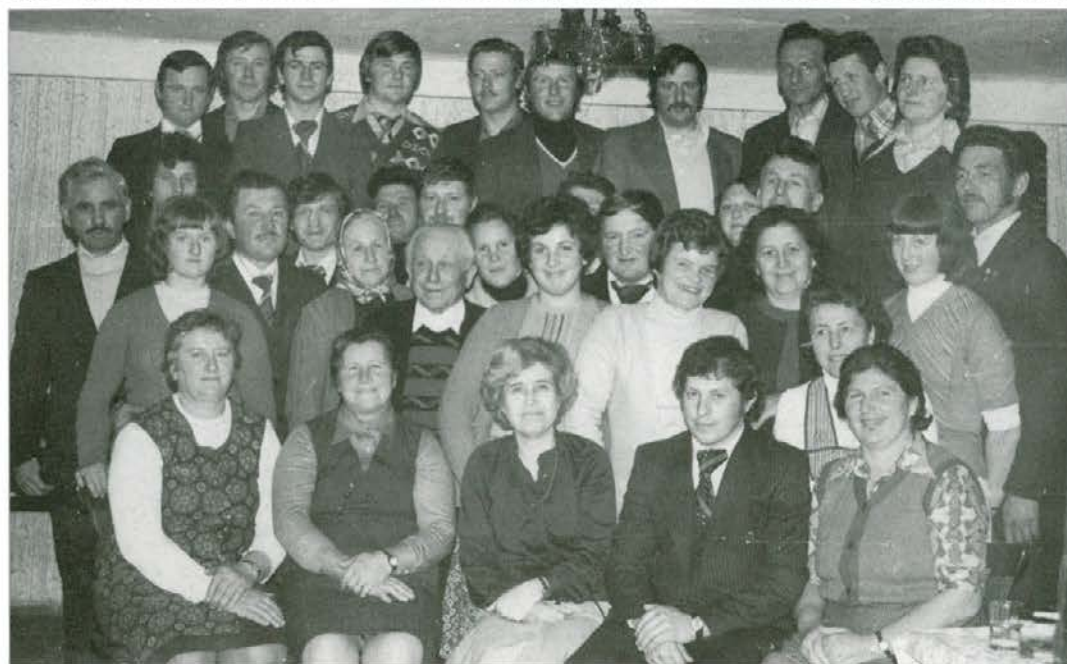
Razborški krvodajalci leta 1979

Na Razborju je še danes aktivna organizacija Rdečega križa, ker se vsi zavedamo, koliko ljudi potrebuje pomoč v različnih življenjskih stiskah. Moje mnenje je, da bi morali na deželi organizirati medsosedsko pomoč, ki jo potrebujejo zlasti starejši krajanje. Na Razborju smo imeli pred leti primer, ko je skoraj umrla mlajša gospa, vendar jo je sosed pravočasno odpeljal v bolnišnico, kjer so zanj lepo poskrbeli. Medsosedska pomoč bi pomenila tudi način druženja in komuniciranja med ljudmi in starejši ljudje bi bili manj osamljeni.