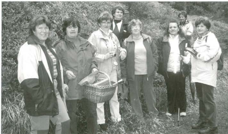
Udeležke študijskega krožka so spoznavale zelišča tudi na terenu, predvsem na območju Kozjaka in Mislinjskega Pohorja.

Študijske krožke kot obliko neformalnega izobraževanja in usposabljanja ob sofinanciranju Ministrstva za šolstvo in šport strokovno vodi in razvija Andragoški center RS.