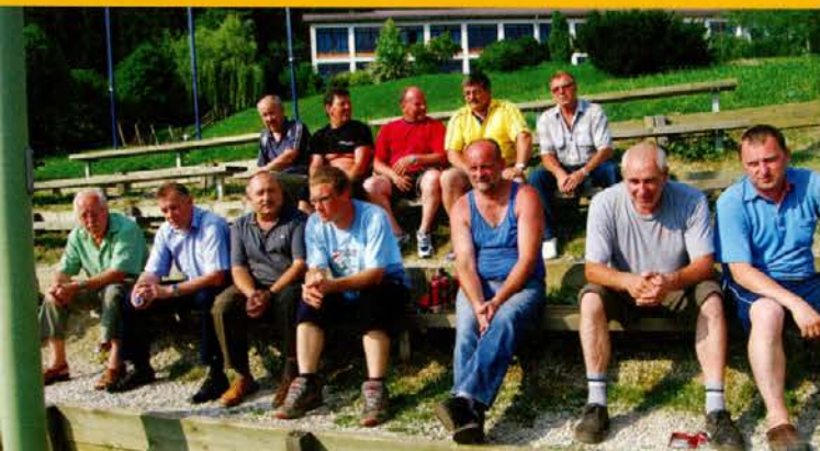
S tribune gledalci z zanimanjem spremljajo tekmovanje.