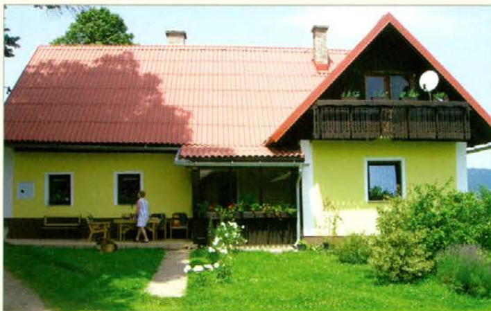
Lepo urejena nova hiša