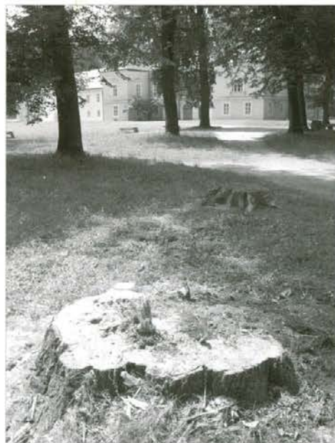
Panj po vetru poškodovane in votle lipe v ravenskem parku