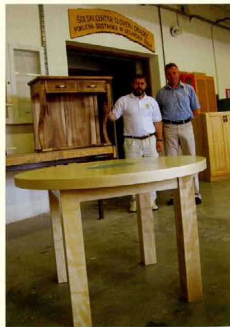
Zadovoljstvo nad izdelki zaključnih letnikov