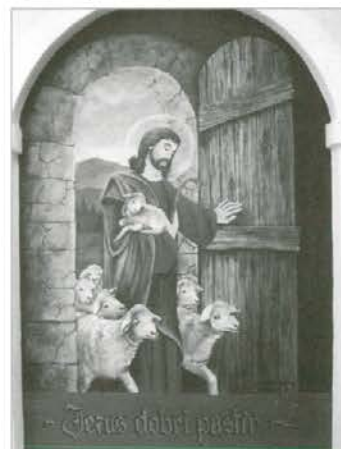
Poslikava »Jezus dobri pastir«

Legnarju. Kot je ob priliki blagoslovitve povedala že sama mlada gospodinja, naj vse domače Legnarjeve in vse, ki bodo hodili mimo te kapelice, spremlja Marijino varstvo.