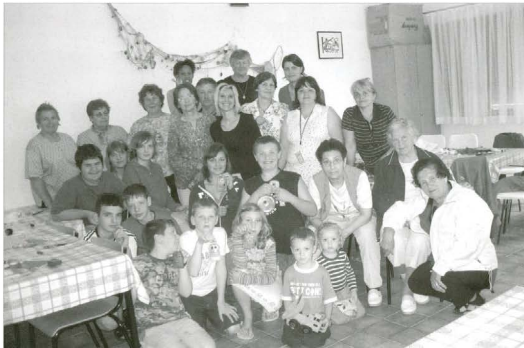
Drugi medgeneracijski tabor

Z novimi izkušnjami in lepimi spomini se je tako tudi letos zaključilo skupno letovanje otrok in starejših. Veselimo pa se že ponovnega srečanja in novih dogodivščin tudi v naslednjem letu.