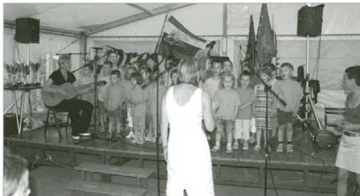
Nastop pameških osnovnošolcev

V kulturnem programu so sodelovali otroci šole Pameče in Godba na pihala Slovenj Gradec.