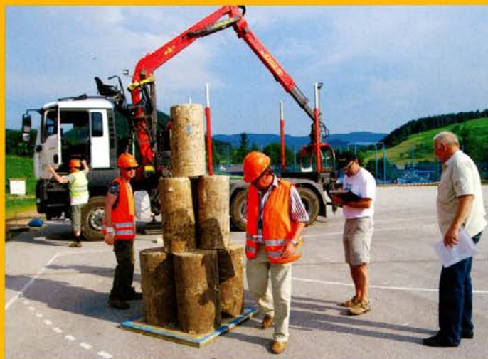
Komisija ocenjuje precizno postavitev.