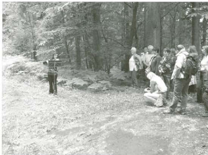
Člani študijskih krožkov so v gozdu prisluhnili violini