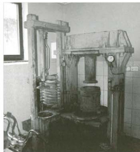
Stiskalnica za pridelavo olja