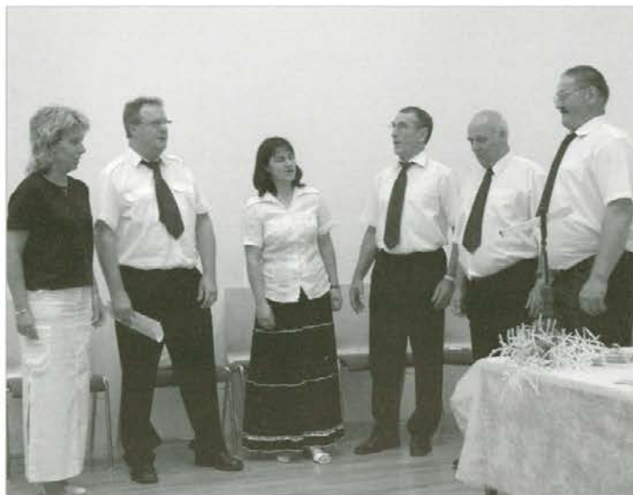
Pevska skupina Smo, kar smo