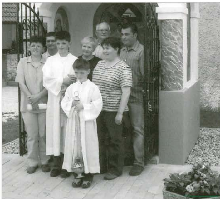
Legnarjeva kapelica, pred njo družina Legnar

kmetije Vrbanovih. To so seveda samo domneve, ki imajo nekaj korenin v župnijski kroniki sv. Urha. To je zgodovina, ki smo se je spominjali na to lepo majsko nedeljo in se veselili lepe kapelice v Srednji vasi v Podgorju. V času, ko človek nima časa, ko vsi drvimo (ne vemo prav, kam in zakaj ...), je še kako lepo, da ljudje najdejo čas, voljo, denar, da obnovijo in ohranijo bogato versko in kulturno dediščino naših prednikov, ki so se zavedali in tudi občutili bogastvo tega sveta. Saj so poznali rek »Da je prazno delo, brez žegna z nebes ...« Tega se zavedajo mnogi sodobni kmetje in gospodarji tudi danes. In sad takega plemenitega razmišljanja je prenovljena kapelica pri