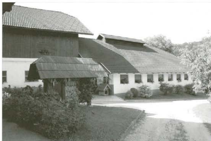
Novo gospodarsko poslopje