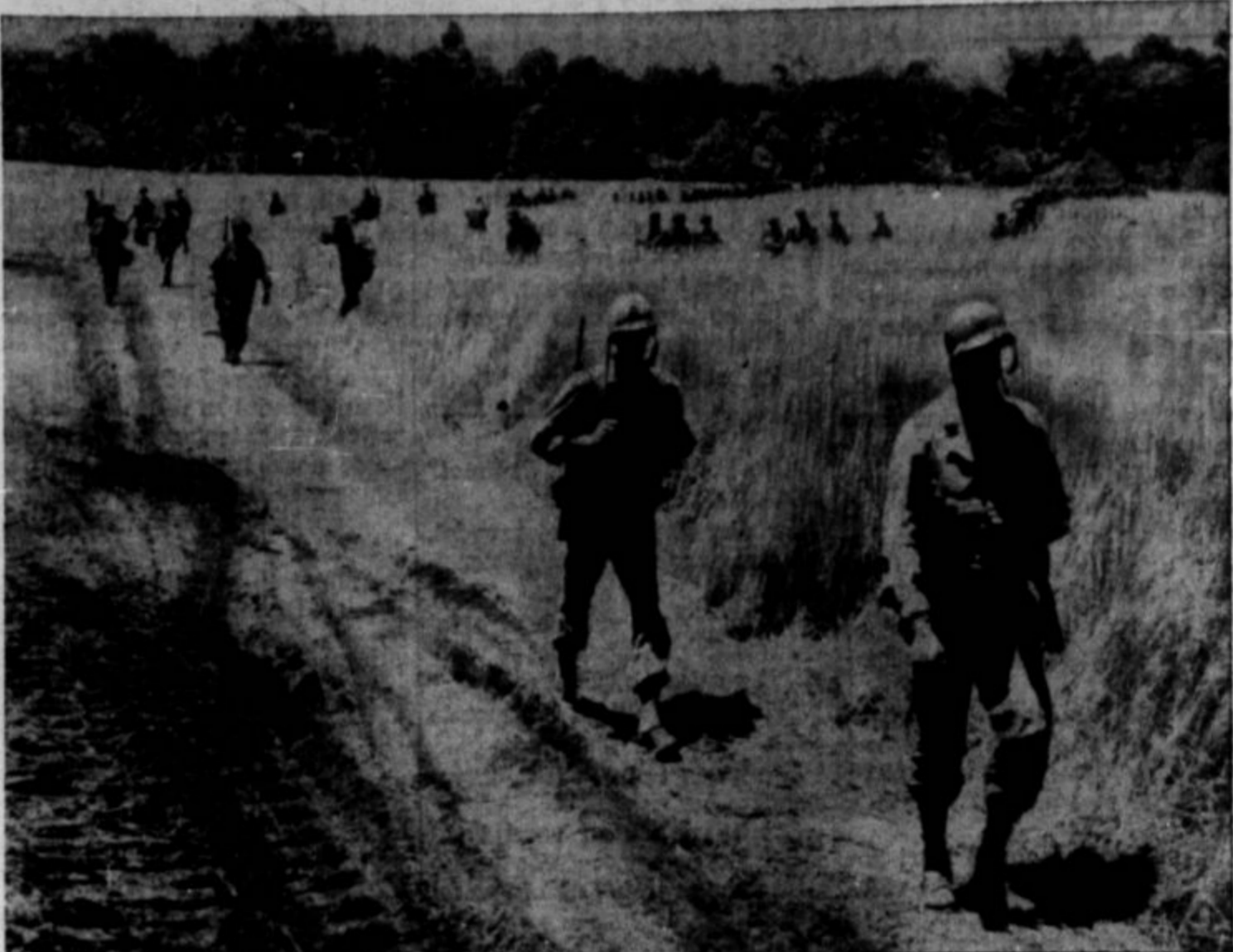
ZAVEZNIŠKI VOJAKI V NOVI GVINEJI NA LOVU ZA JAPONCI.

Kralj Emanuel je obljubil sneti svojo krono čim zavezniški osvobodijo Rim. To je storil. Vlado vladarja je dobil njegov sin kronprince Umberto. To je torej v tej spremembi edina razlika. Reševanje monarhij v Eypri je v bistvo reševanje starega reda. Vsak kralj, ki ostane, pa naj bo grški George, jugoslovanski Peter, nizozemska Wilhelmina itd., pomeni potiskanje ljudstva v nekdanje razmere. In ob enem