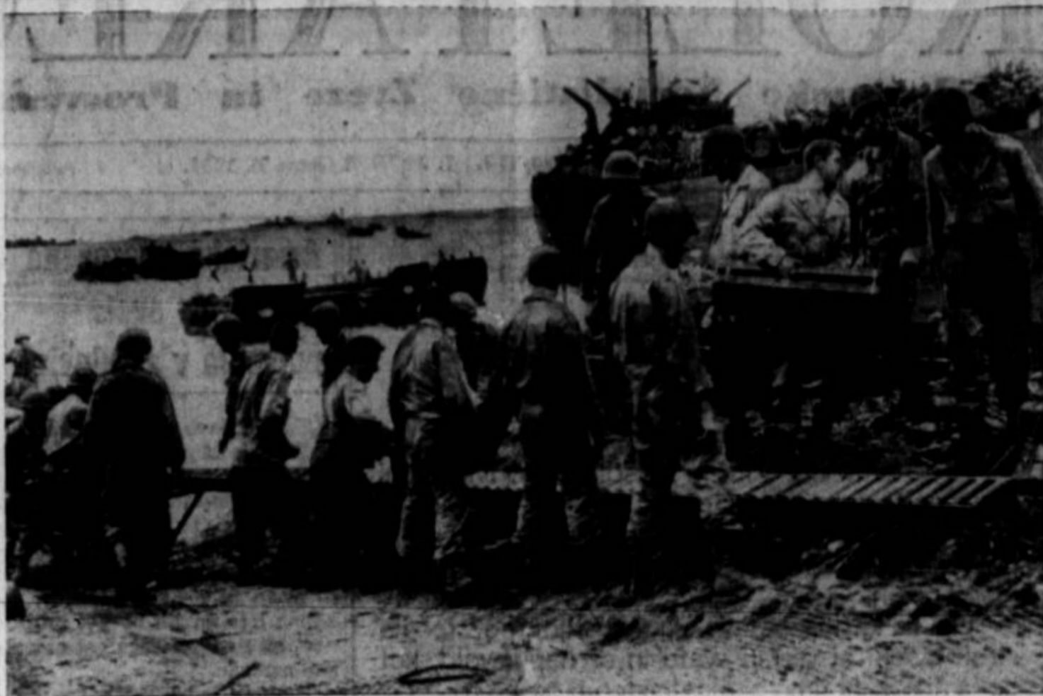
IZKRCATI Z LADIJ MOSTVO ni najtežje opravilo. Ampak kako istočasno in z največjo naglico vreči na obrežja tanke, topove, tovarne avte, municijo, živila in vse drugo kar treba, je pa drugačen problem. Gornje je slika z obrežja nekakega otoka na južnem Pacifiku, kjer so ameriške čete zgradile v naglici zaslitni konvektor, po katerem dobivajo z ladij potrebščine po valjarjih z največjo možno brzino.

Churchill je v svojem govoru o pojemanju ideologij v tej