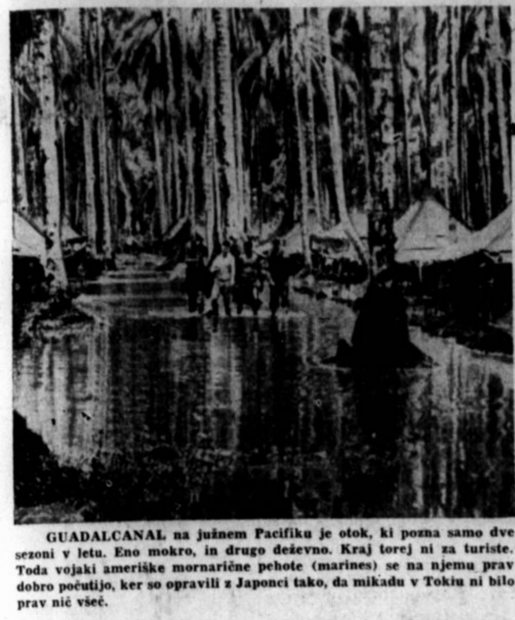
GUADALCANAL na južnem Pacifiku je otok, ki pozna samo dve sezoni v letu. Eno mokro, in drugo deževno. Kraj torej ni za turiste. Toda vojniki ameriške mornarice pehote (marines) se na njemu prav dobro počutijo, ker so opravili z Japonci tako, da mikadu v Tokiu ni bilo prav nič všeč.