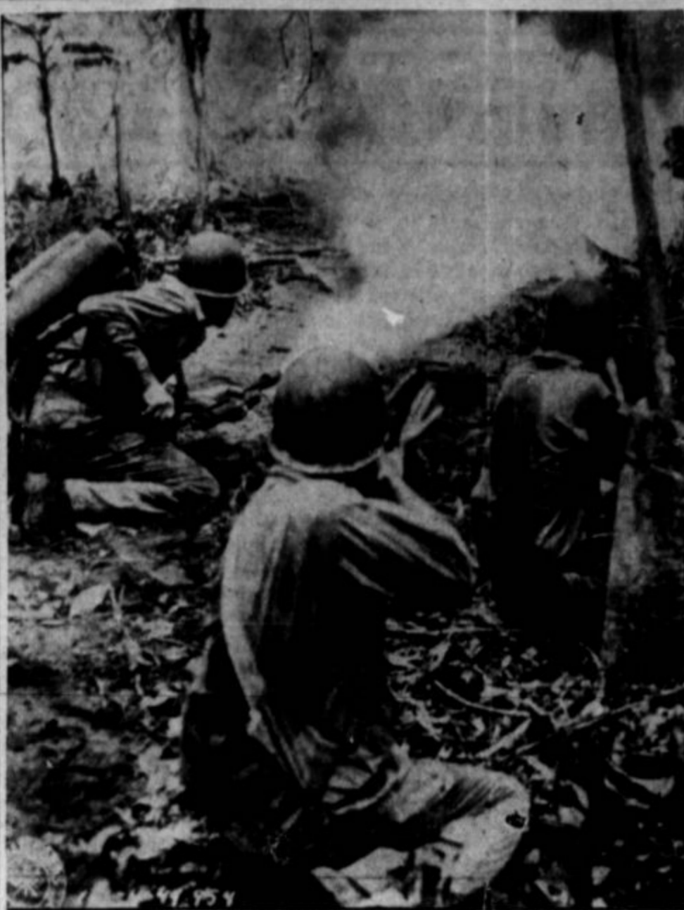
AMERISKI METALCI OGNJA (flamethrowers) nekje na južnem Pacifiku v napadu na Japonce.