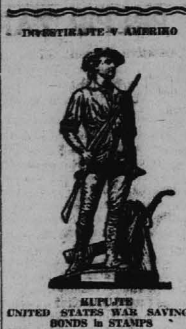
KUPUJTE UNITED STATES WAR SAVINGS BONDS in STAMPS

Iz tega razloga apeliram na ves slovenski narod širom Amerike, da delujete po vaši najboljši moči in da izkoristite vsako priložnost za nabira-