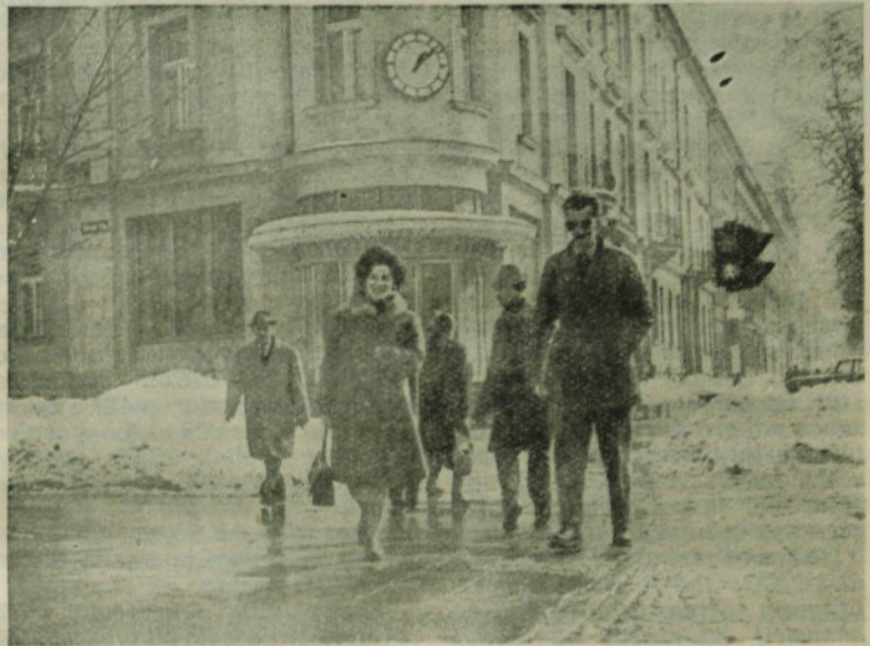
Kamničani si ogledujejo Celovec, Celovčani pa Kamničanke

Zadovoljni z odličnim programom revije, saj nikomur ni bilo žal tega izleta, smo se okrog 9. ure zvečer spet preko Jezer-