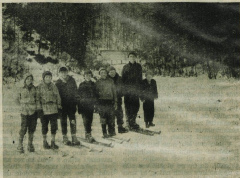
Četica pionirjev, ki so se poskusili v skokih

ugodnih snežnih razmerah v naslednjem letu tako kvalitetno kot kvantitetno izboljšala afirmacija pionirjev, ker bodo le tako imele smučarske sekcije dovolj mladega kadra iz vrst pionirjev oziroma mladincev. Otroci pa imajo s tem možnost zdravega razvedrila, vzgoje v disciplini in tovarištvu, kar naj bo odlika vsakega pionirja.