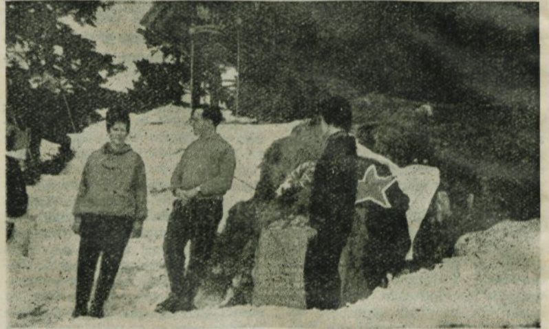
Tekmovalci pri polaganju venca