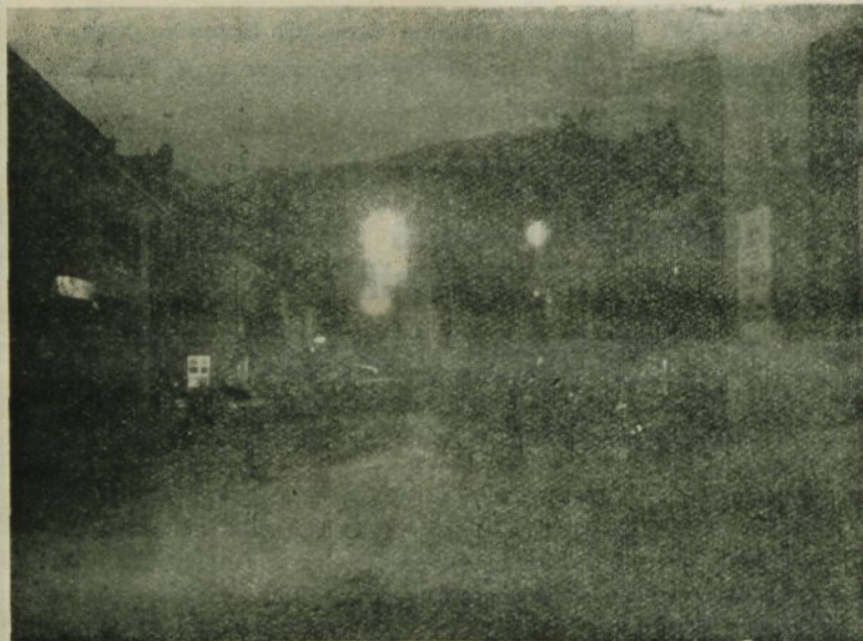
KAMNIK v jesenski dolgi noči... Ali se Vam ne zdi, da je naše turistično mesto slabo razsvetljeno? Ali ste videli turistična mesta drugod?

NAVPIČNO: 1. znano podjetje v Kamniku, 2. vzklík planincev, 3. poljska cvetlica, 4. os. zaimek, 5. egipt. božanstvo, 6. znamka izdelka kamniške tovarne, 7. primorska jed, 8. zaničljiv izraz za neodločneža, 12. prelep park v bližini Kamnika, 15. ime kamniške cvetličarne, 16. nasičen, 18. vrsta zemlje, 19. prsi (edn.), 22. del teniške igre, 23. sij, zarja, 24. gora na Primorskem, 26. naval, naskok, 28. del okostja, 30. del obdelane zemlje, 32. okrajševalnica za našo armado, 33. naslov romana češ. pisatelja Karla Capka, 35. isto kot 17. vod., 36. znak za manjšo utežno mero.