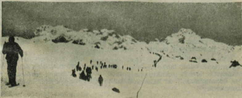
Pohod se je odvijal v 1 km dolgi koloni

ga odbora ZB ter ostalih organizacij izpeljejo res odlično. Vse je potekalo brezhibno. To dokazuje, da je možno s skupnim sodelovanjem doseči res veliko.