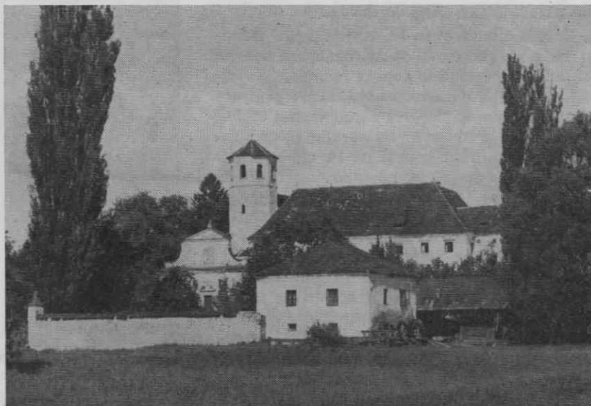
Pogled na samostanska poslopja, na cerkev, mlin in del samostanskega zidu pred drugo svetovno vojno

Ker so redovna pravila cistercijanov zahtevala v srednjem veku od vseh svojih samostanov enotnost tudi glede razporeditve in namembe prostorov v samostanskem poslopju, je tej zahtevi moral vsekakor zadostiti tudi kostanjeviški samostan. 5 Sami samostanski dokumenti nam o arhivu za obdobje srednjega veka žal ne povedo prav ničesar. Nekaj podatkov, sicer precej skromnih, pa nam za