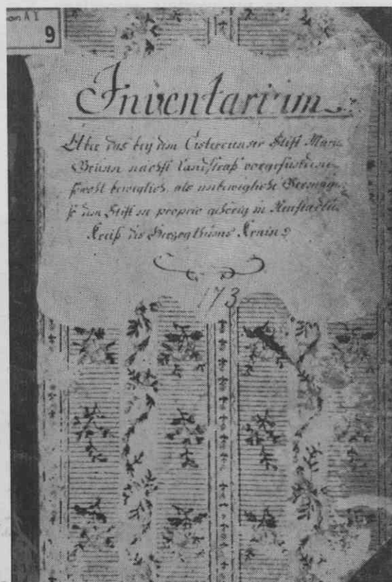
Faksimile naslovne strani samostanskega inventarja iz leta 1786 (Arhiv Slovenije)

Z ukinitvijo samostanov pod Jožefom II. je za samostansko arhivsko gradivo napočil nov