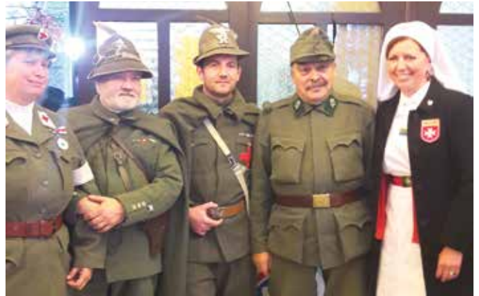
na sliki: bolničarka Rdečega križa, italijanska vojaka iz enot Alpinov, avstrijski vojak gorske enote, bolničarka Malteškega reda