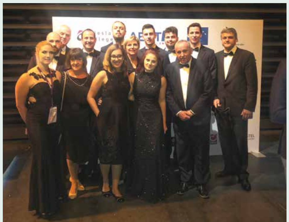
Študenti in njihovi mentorji