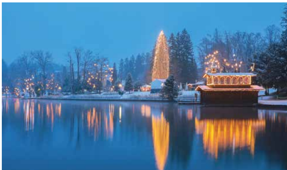
Zimska pravljica na Bledu