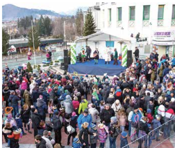
Lani je bilo silvestrovanje za otroke v Trgovskem centru Bled, letos bo na Jezerski promenadi.