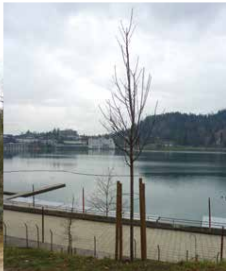
Skupina macesnov (levo), divji kostanj, gorski javor in hrast graden (v sredini) ter divja češnja (desno) so del podmladka, ki je zaživel vzdolž Veslaške promenade.