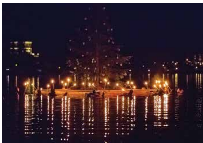
Lanska uprizoritev Legende o potopljenem zvonu

Bled je eno izmed najbolj romantičnih mest v Sloveniji, ki skriva mnogo legend in zgodb. Eno izmed njih, Legendo o potopljenem zvonu, vsako božično popoldne skupaj s člani Društva za podvodne dejavnosti Bled tudi uprizorimo in s tem voščimo lepe in tople praznike.