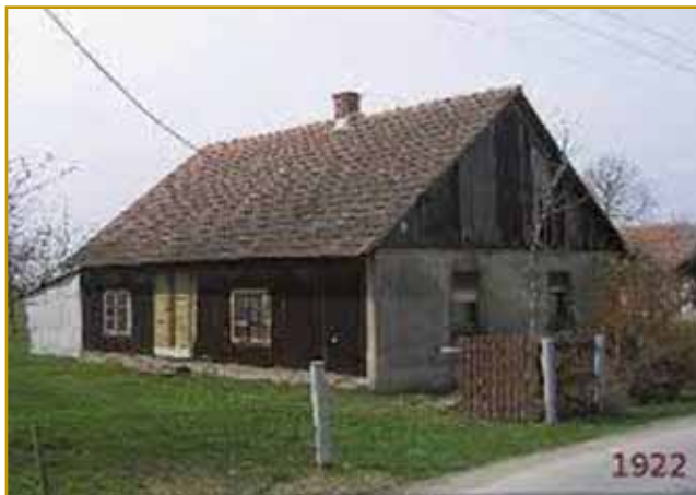
Druga kolonija se je 1922. leta v Benici organizeralo. Tam eške gnesden leko vidimo, kakše rame so najprva meli. Vcejlak prausni so bili, v nji so velke držine živele. Moramo vedeti, ka tri generacije so tó vküper prišle; od dejdeka do vnükecov.

Tri lejta se je njiva mantrni-ja vlekla. Eni rejdko so dobro obodili, tisti, stere so velki