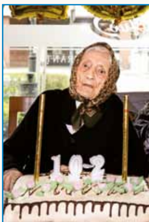
Najlepši pa največji svetek... stran 3