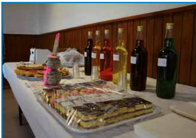
V Budincih so pohodnike pričakali z domačimi dobrotami, čajem in likerji

pohod po pouti po dolaj pa bregaj. Pohod, ki bi tradicionalno potekal ob svetih treh kraljih, so organizatorji zaradi epidemioloških razmer tokrat prestavili na april, natančneje na cvetno nedeljo. Hladnejše, a sončno pomladno dopoldne je v najsevernejšo vas Slovenije privabilo več kot sto pohodnikov, med katerimi je bilo veliko že znanih obrazov, veliko pa se jih je na že znano krožno pešpot podalo prvič.