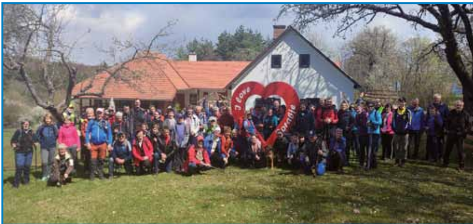
Pohodniki pri Porabski domačiji v Andovcih

Pri lično urejenem lesenem nadstrešku so pohodnike s pijačo in pecivom že pričakali domačini. Na krajšem postanku, ki je bil po nekaj pre-