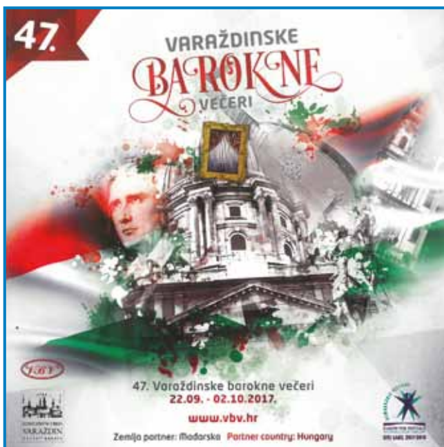
VBV 2017, Madžarska, Arhiv VBV, Varaždin

Iz navedenega sledi, da je množica manj ali skoraj neznanih (baročnih) skladateljev in predstavnikov »zlatega« ali visokega