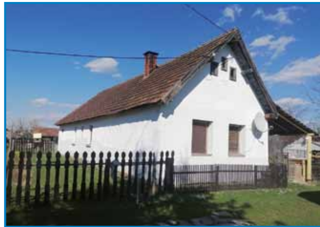
V taum rami, gde se je že njigvi dejdek naraudo, živejo Ani s sinaum

travo trbej kositi. V ogradca se tö začne delo. Kak je toplejšo tak več dela je, lük, petroš pa mrkevco sem taposadila, drügo pa te gda bola topla zemla baude. Na tejm