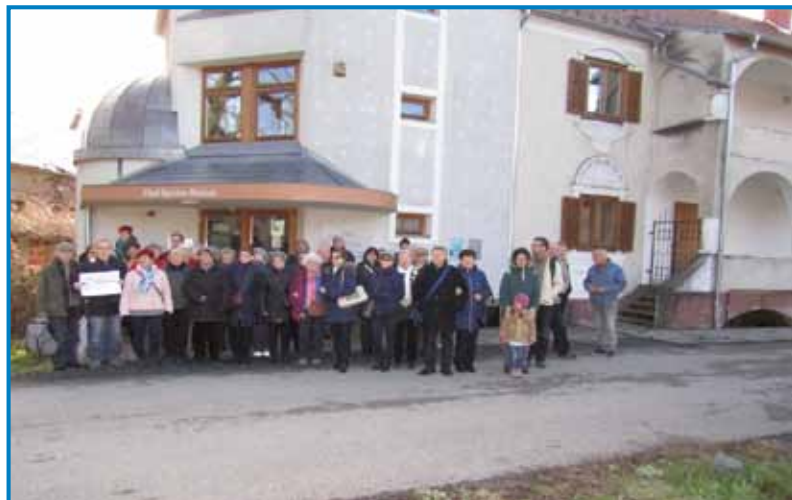
Pavlovi vandroške pred Muzejom Avgusta Pavla

Na letošnje cvejtne nedelo – 10. aprila – smo Sombotelska slovenska samouprava, SKD Avgust Pavel pá organizérali