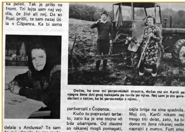
Kejpa iz članka Porabske družine

spacal nešolan, da ne rečem primitiven Madžar, ali pa kak Porabski Slovenec, da ne rečem kakšen. Vseeno, kateri koli je bil, le jaz si ne morem predstavljati, kaj omenjene ljudi spodbuja, da se loteva-