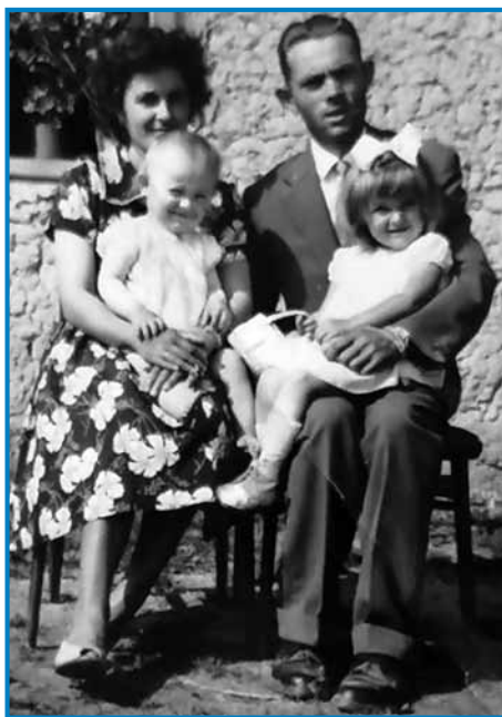
Ani z možaum pa dvöma detetoma v mladi lejta

»S kravami, vsigdar tak, ka gda so se krave napasle, te smo kaula naklali, depa samo malo, pa smo domau pelali. Tau je tak šlau cejlo leto. Zdaj bi že tašo nej mogo, zato ka od majuša naprej že ne smejš v gauštjo, če te zgrabijo, ka tam kaj delaš, velki štraf plačaš. Ne vej,