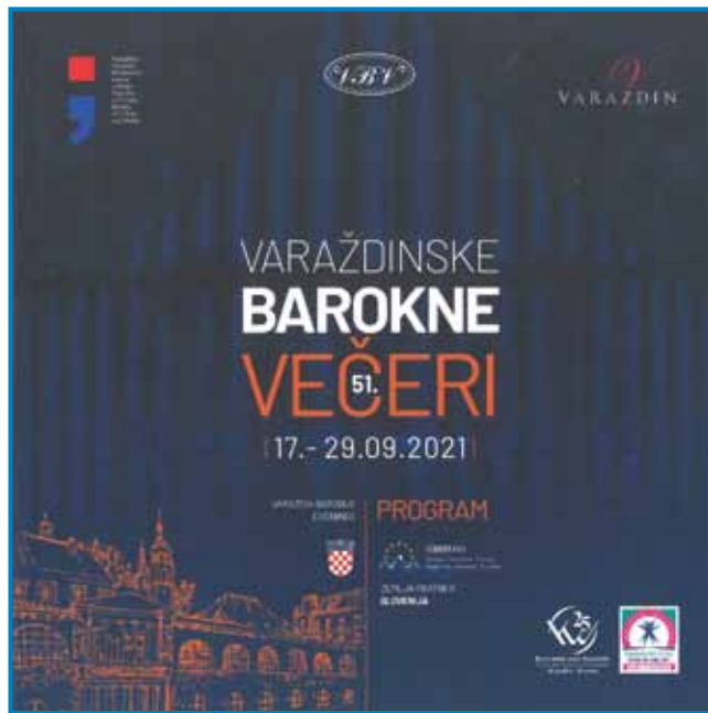
VBV 2021, Slovenija, Arhiv VBV Varaždin

zaključujemo z dokaj izenačenim pregledom le-teh na primeru enega od pomembnih srednjeevropskih glasbenih festivalov Varaždinski baročni večeri. Ta poteka vse od l. 1971, ko se je prvič zgodil v hrvaškem baročnem mestu Varaždin, pa vse do dandanes, vsako leto koncem septembra. Za nami je zdaj že 51 tovrstnih edicij, vrli Hrvati pa so zagotovo že v zaključnih pripravah na letošnjega (2022), 52. Mi bomo zaradi okrogle številke 50 pogledali le v njegov polstoletni razvoj in še to samo v tiste fragmente, ki nekako v dokaj enovitem geografskem prostoru upoštevajo in prikazujejo madžarsko, hrvaško in slovensko glasbo baročnega časa, torej eno stoletje in pol (17., prve polovice 18. stol.) na tem festivalu.