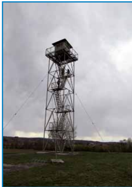
Graničarski törem na Hodoši je gnes oprejtji za turiste

vküper z Muzejskim društvom Pavlovo paut. Letos smo šli v Slovenijo v ves Krplivnik pauleg Hodoša, gde majo Madžari svojo etnološko izo. Za toga volo smo se zdaj nej s cugom pelali, liki z busom, bilau nas je blüzi petdeset. Najprve smo gorpoiskali Muzej Avgusta Pavla v Monoštri.