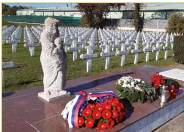
Grobi v Sárvári nejmo pripovejdajo o noriji bojne pa ideologije

je vse baukša vöglejdala. Tak je tó v kolonijaj Pince-Marof, Kamovci pa v Dugoj vesi bilau. Leko bi prajli, ka vse bole so domanji lidge bili, vse več zemle so meli, vse več so delali. Dokejč, dokejč je nej do druge velke bojne prišlo. Slovenija je aprila 1941 oku-pejrana bila. Prekmurje so Madžari vzeli. Primorce so eden čas na mejri njali, do-kejč so je nej 23. junija 1942 vse v lager v Sárvár odpelali. V njive rame, na njivo zemlo so se simpatizeri madžarsko-ga okupatora naselili. V lage-ri so že Srbi iz Vojvodine bili,