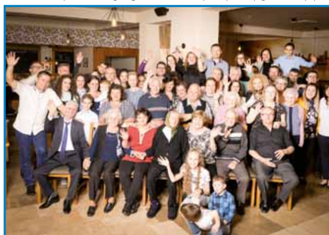
Na 102. rojstnom dnevi se je vküpnajšla velka familija, bilau nji je več kak petdeset

moramo vtjüper sprajti, vsakši je od leta do leta starejši pa nej gvüšno, ka mo eštje meli priliko za taši veltji, veseli program.