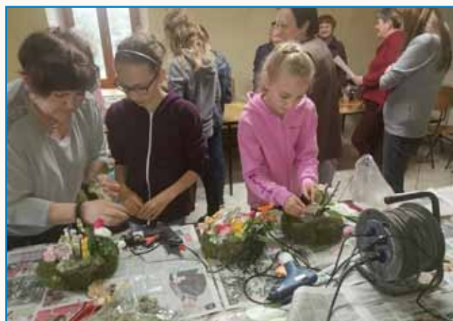
Velikonočna delavnica v Števanovcih stran 10