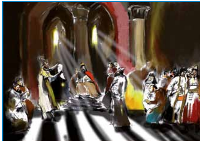
Leta 1222 je bil madžarski kralj Andraž II. primoran izdati »Zlato bulo« - listino v latinščini je dobila ime po zlatem pečatu, ki je visel na njej

žarski kralj Štefan I. Novi vsemogočni veleposestniki niso več spoštovali pravic