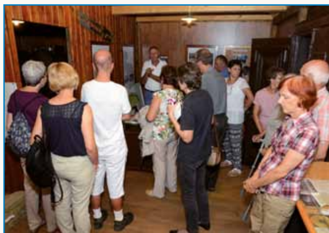
Pripovedi iz slovenskih krajin stran 9