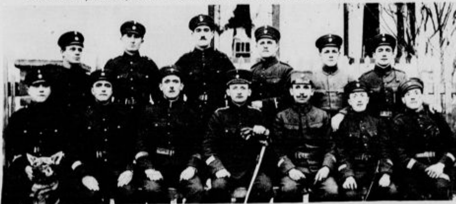
Finančna straža v Pincah pri Lendavi ob jugoslovansko-madžarski meji.