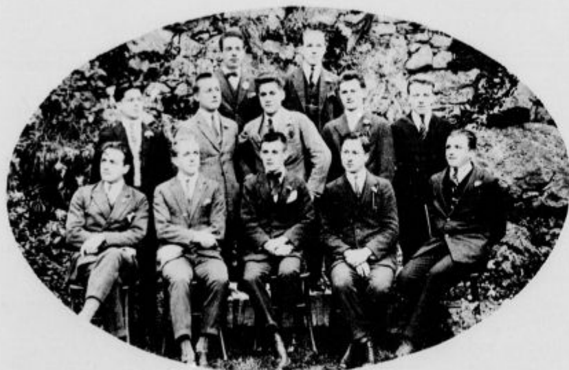
Odbor dijaškega društva „Borba“ na kmetijski šoli na Ormu pri Novem mestu.