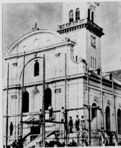
Nova župna cerkev v Šmarjeti na Dolenjskem.