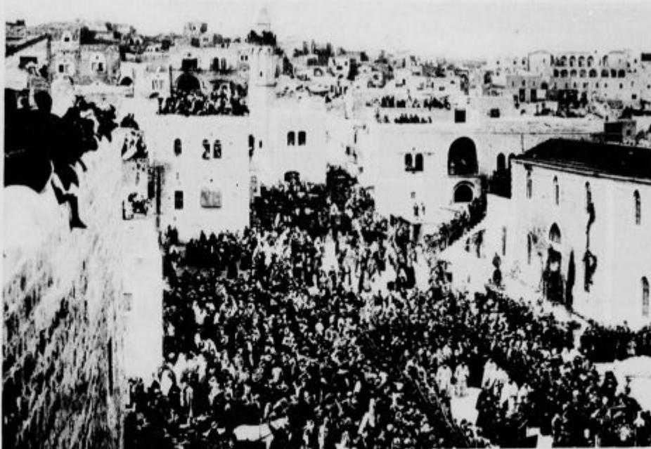
Slovesna procesija na božični dan v Bellehemu v cerkev božjega groba.

V zadnjih letih je bilo pri nas zgra-jenih precej novih cerkva. Kljub veliki draginji — stroški za tako stavbo, kot je cerkev, gredo takoj v milijone — so naši verni ljudje izredno požrtvovalni, ker vedo, da je to velik dušni kapital, ki se jim splača na tem in onem svetu. To se zlasti vidi v Ljubljani, kjer so po vojski dovršili tri nove cerkve: sv. Jožefa, na Rakovniku in eno najlepših v Slo-veniji: v Šiški. In sedaj tudi že v Mostah, ki je prav za prav del Ljubljane, mislijo na to, da bi si postavili novo veličastno cerkev ter ustanovili lastno župnijo. Slika nam kaže novo cerkev v Šmarjeti na Dolenjskem. Građi se s prostovolj-nimi prispevki. Sicer ni zidana v mo-dernem slogu, a je procelje zelo veli-časno tudi za današnjega človeka. Bog daj, da bi iz nove cerkve rosila obilica božjega blagoslova na dušo in telo šmarjetskih župljanov.