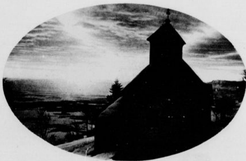
Gorska cerkvica sv. Ambroža pod Krvavcem v snegu.

Cerkvica sv. Ambroža stoji pod Krvavcem, ki je eden najprijaznejših vrhov Kamniških planin. Dobro oskr-