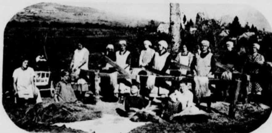
Terice v vasi Šmarata pri Ložu terejo lan, iz katerega se tke domače platno, ki se žal pri nas vedno bolj izgublja.