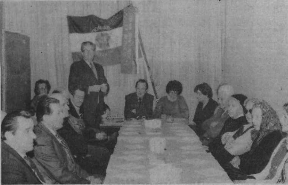
SKUPŠČINA KRAJEVNE ORGANIZACIJE ZB NOV IVAN KAVČIČ-NANDE