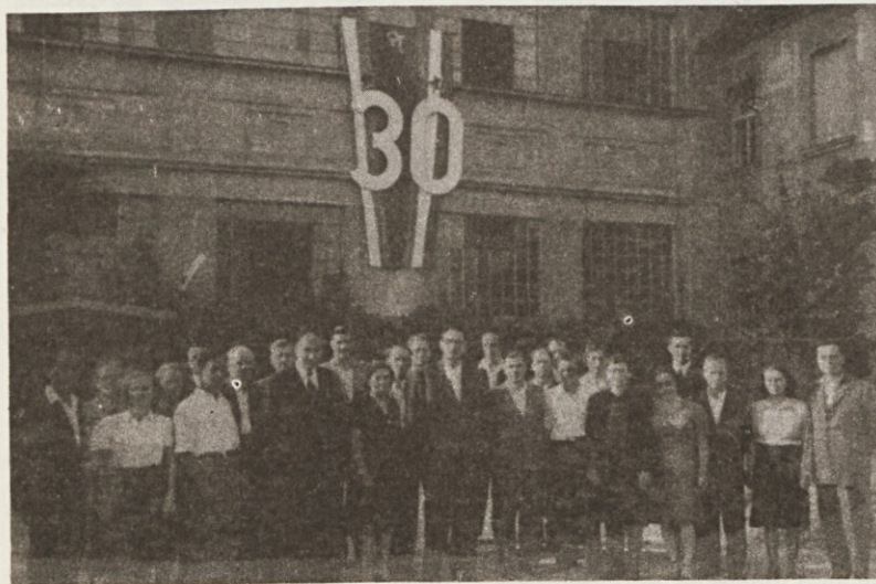
Ob 30-letnici s prvim delavskim svetom Saturnusa.