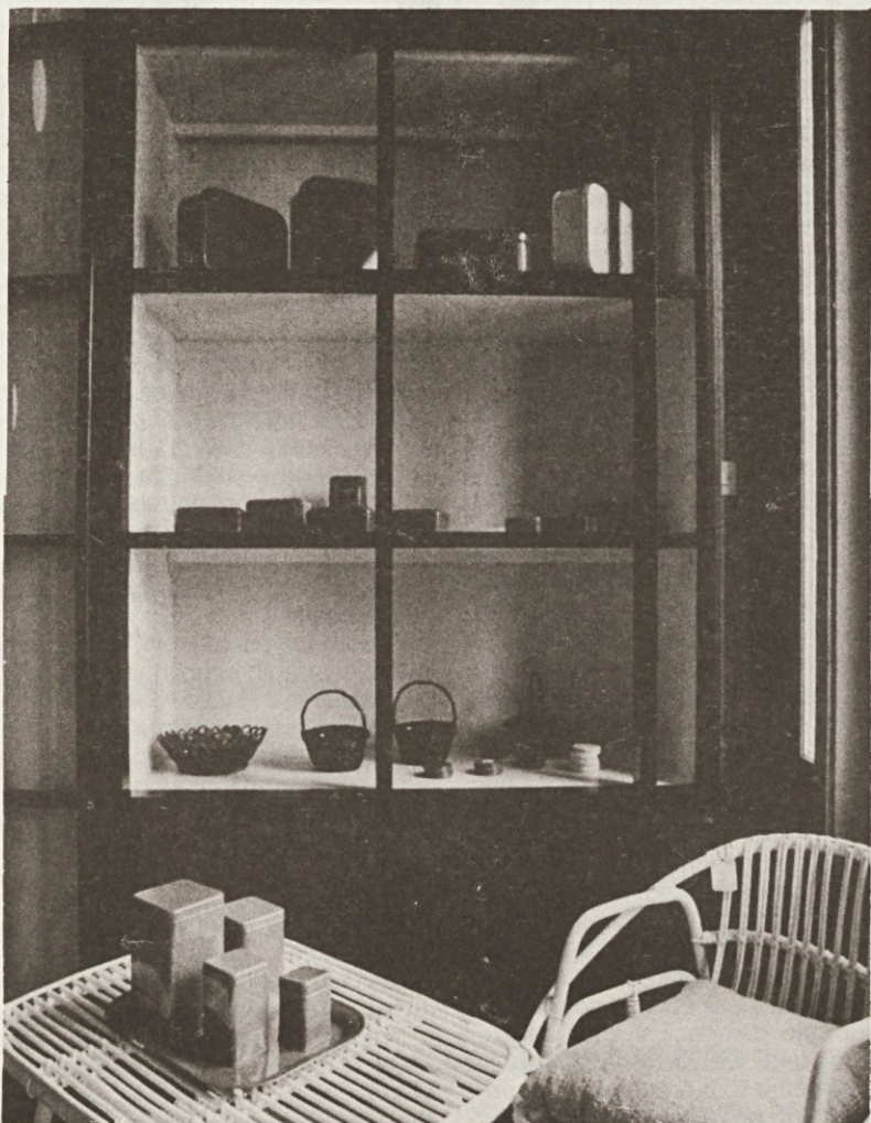
V novem Filipovem dvorcu najdemo, ali naj bi vsaj našli, prostor predvsem predmeti, ki so »nekaj posebnega«. Med njimi ponujajo tudi barvaste pločevinate škatle, kakršne so v tozdu embalaže delali za galerijo Sebastijan.