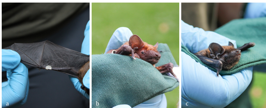
SLIKA 16. a) Obroček na netopirjevi prhuti, b) navadni mračnik ( Nyctalus noctula ), c) gozdni mračnik ( Nyctalus leisleri ).

Ob koncu dneva smo ob pregledu naleteli še na navadnega mračnika ( Nyctalus noctula ), v predzadnji netopirnici pa na dva gozdna mračnika ( Nyctalus leisleri ). Obeh vrst smo se zelo razveselili, saj smo tako lahko videli še večje slovenske vrste netopirjev. Za zaključek dneva smo ob bližajočem se sončnem zahodu opazovali izlet osmih drobnih netopirjev, ki smo jih našli v eni izmed zadnjih netopirnic, iz bombažne vrečke.