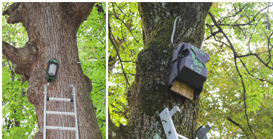
SLIKA 14. a) Duplasta in b) ploščata kolonijaska netopirnica iz ljubljanskega Tivolija.

Ni lepšega kot sprehod skozi tivolski park na lep, sončen jesenski dan. Pod nogami svetlo zelena, že na pogled mehka trava, ob pogledu navzgor pa s soncem obsijano zeleno listje dreves, ki ga na mestih že prepaja rahlo oranžna barva. Ob opazovanju živahno plesočih se listov visoko na deblu opazimo postavljeno ptičjo hišico. A tu nekaj ni prav! Zakaj je na ptičji hišici silhueta netopirja?