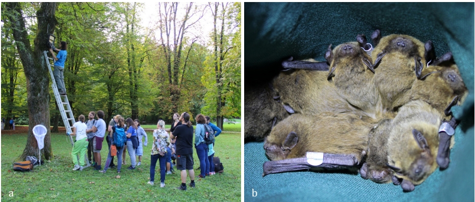
SLIKA 17. a) Jesenski pregled netopirnic v ljubljanskem Tivoliju, b) skupina drobnih netopirjev ( Pipistrellus pygmaeus ) iz netopirnice na Grajskem griču.

Prvi torek v oktobru, 3. 10. 2023, smo se še zadnjič zbrali na pregledu netopirnic. Ta dan smo pregled opravili na Koseškem bajerju in na Prulah. Skupno smo pregledali 12 netopirnic, netopirji pa so za svoja začasna zatočišča izbrali le dve netopirnici v okolici bajerja – v prvi netopirnici smo našli enega samca, v drugi pa štiri samice drobnega netopirja. Preostanek dneva smo preživeli v upanju na naseljeno netopirnico in ob deljenju terenskih izkušenj.