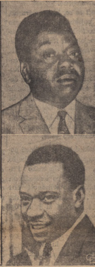
Zgoraj premier Katange Moise Tshombe, spodaj premier centralne vlade Konga Cyrille Adoula.