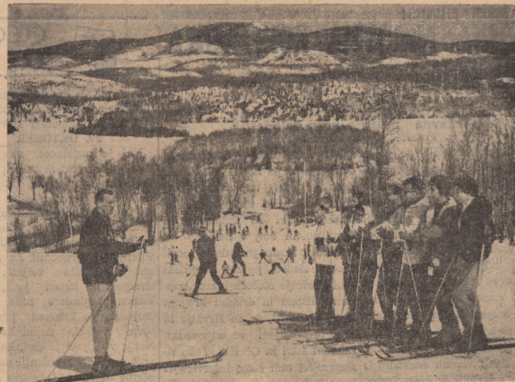
Samo petdeset minut iz Montreala, pa si že v osrčju Quebeškega smučarskega raja: Laurentian. (Can. Scene).

• Katoliška univerza v Lublinu je edina katoliška univerza, ki je odprta v kaki komunistični državi. Kljub temu, da se vzdržuje zgolj s privatnimi darovi, ne zahteva od akademikov nikake šolnine in nudi sorazmerno enako število štipendij kot državne komunistične univerze. Odstotek akademikov iz delavskih in kmečkih družin (65%) presega njih odstotek (približno 50%) na državnih vseučiliščih. Vseučiliška knjižnica šteje 400.500 knjig in prejema 350 poljskih in 1002 inozemskih revij. • Sveta Stolica je dovolila vernikom v Argentini in Peruju, da smejo uporabljati pri recitirani maši špansčino v približno isti meri kot smo smeli mi slovensčino v Sloveniji že pred desetletji. Sedaj so zaprosili za isti privilegij škofje Brazilije.