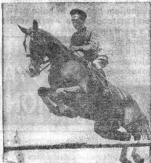
Japonski major Riči vodi japonske jahače, ki se bodo udeležili olimpiade v Berlinu. Jahači so pred dnevi že odpotovali iz Jokohame v Evropo

Ako namreč ne pride do sporazuma z Nemčijo, predlaga Anglija, da bi ona, Francija in Italija skupno z vsemi vojaškimi silami prevzele jamstvo za varnost avstrijskih in češkoslo-