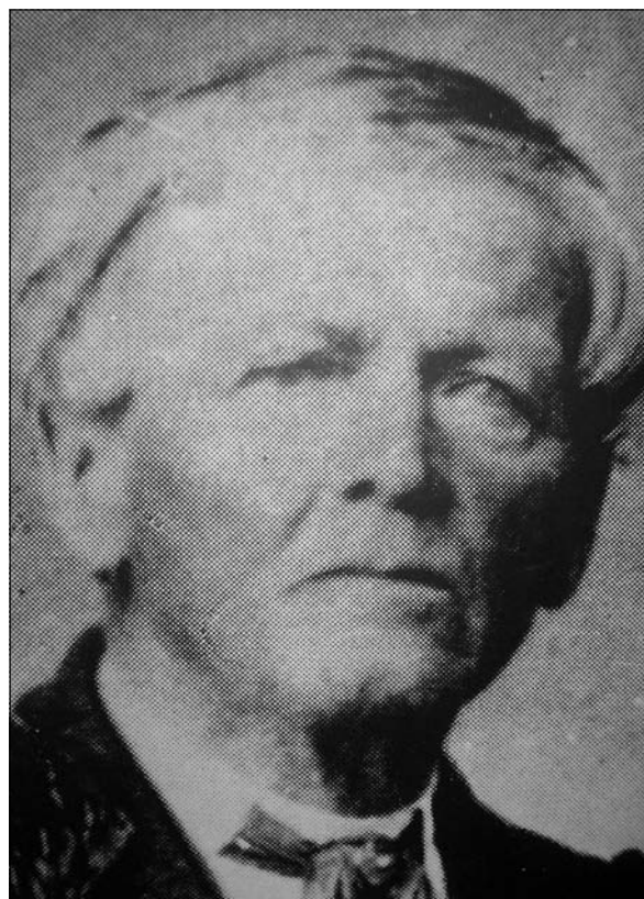
Peter Musi – pedagog, učitelj, knjižničar, hranilničar, pisec, priložnostni pesnik, organist, sadjar, čebelar in kmetovalec ( http://www.knjiznica-velenje.si/ )

V tem času je Peter Musi nadaljeval svojo študijsko izobraževanje in 4. julija 1822 uspešno opravil izpit za poučevanje v 1. in 2. razredu nemških glavnih šol. Z izobrazbo, ki jo je imel, je lahko 10. oktobra 1822 zaprosil za mesto učitelja v Šoštanju. Prošnja je bila hitro sprejeta in 15. aprila naslednje leto je krajevni šolski nadzornik priporočil Musija za rednega učitelja. Musiju je bilo v pomoč, da je poleg nemščine obvladal tudi slovenski jezik. S tem je Musi dobil podlago za pedagoško dejavnost, katero je kontinuirano izvajal celotno svoje poklicno življenje. 2 Peter Musi je neprekinjeno opravljal delo rednega učitelja uradno do 1. novembra 1872, stvarno pa do 27. marca 1873, ko se je upokojil. To pomeni, da je neprekinjeno deloval najprej kot provizorični učitelj in organist 3 v letih 1822-1823, nato učitelj v letih 1823-1827, kot vzorni učitelj 1827-1870 in kot nadučitelj 1870-1872/73 kar 50 let. 4 Čeravno je 1828 v Celovcu opravil izpit za poučevanje v tretjem razredu glavnih šol in celo dobil povabilo, da bi začel poučevati v Celju, se je Peter Musi odločil,