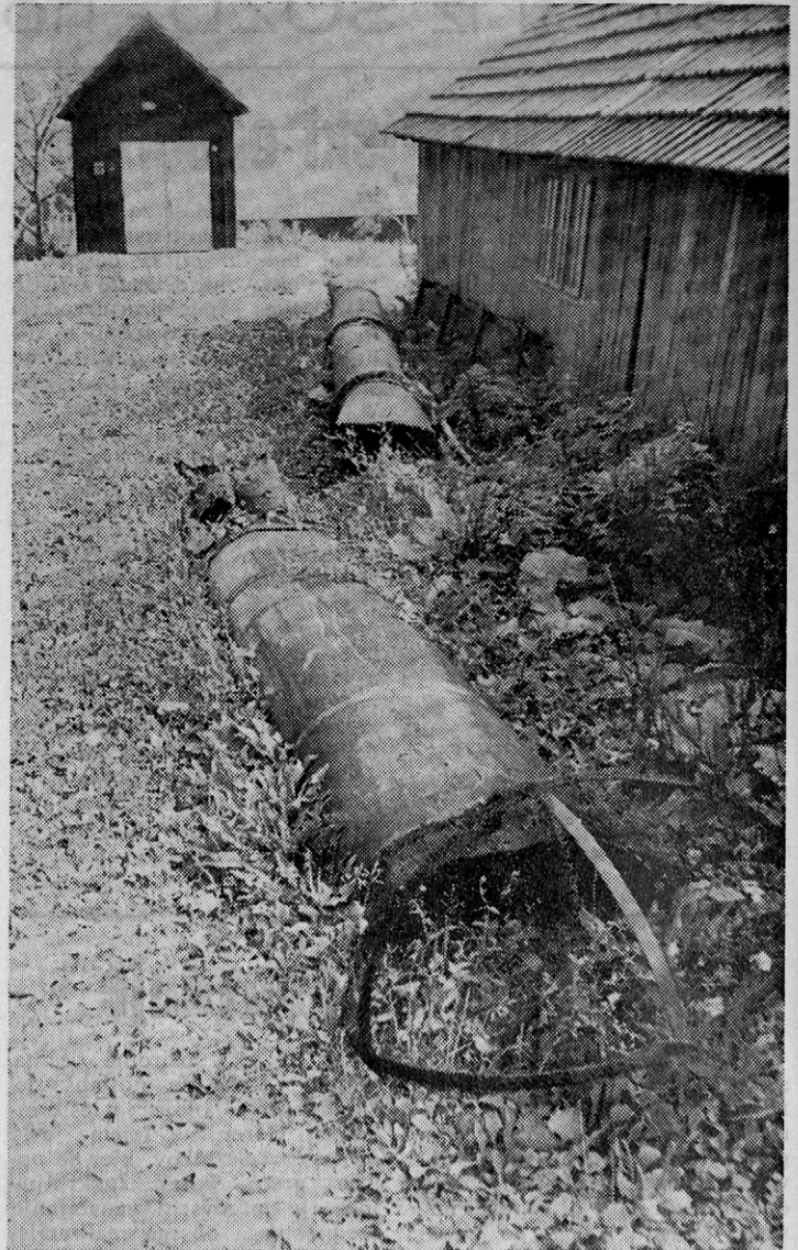
Vrsto let so me občudovali, sedaj pa...?

(povzetek iz Gospodarski vestnik — povzetek slov. — nem. j.)